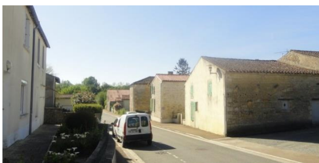
Pignons sur rue dans la rue du Port qui descend vers le marais

Entre les rues structurantes du bourg et le marais, s'étend un tissu bâti moins structuré, composé de petites ruelles et impasses où le bâti s'entremêle avec des jardins, prairies humides, et accès aux marais.