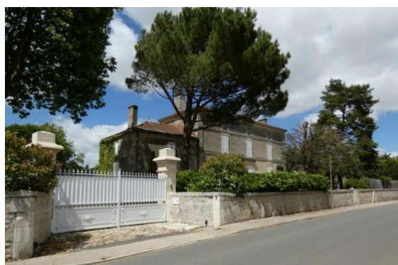
Maison de maître rue Principale dans Le Bourg / Datation : 4e quart 19e siècle

La propriété est délimitée, notamment côté rue, par un mur de clôture interrompu par une porte piétonne, dans l'axe de la demeure, et par un portail à piliers maçonnés, au sud-ouest. Elle englobe la demeure, en retrait par rapport à la voie, derrière un jardin, et des communs et dépendances (grange, étable, toit à porcs, buanderie...), à l'ouest et au nord-ouest. La demeure est constituée d'un corps principal de bâtiment, haut d'un étage et d'un surcroît, et de deux ailes, chacune composée d'un rez-de-chaussée et d'un surcroît. L'ensemble est d'une parfaite symétrie. Chacun de ces trois corps de bâtiments est couvert d'un toit à croupes (une seule croupe pour les ailes). Le toit du corps central est orné d'épis en zinc et d'une crête de faitage en terre cuite, et il est souligné par une corniche. Sa façade, encadrée par des pilastres, est marquée par des bandeaux d'appui moulurés. La porte centrale possède un encadrement mouluré, sous une corniche.