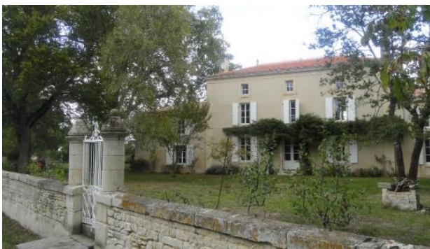
Maison de maitre rue de l'Eglise dans le bourg Datation : 3e quart 19e siècle

La propriété est délimitée sur la rue par un mur de clôture interrompu par un portail et une porte piétonne. Chacun est encadré de colonnes surmontées d'un amortissement et d'une boule.