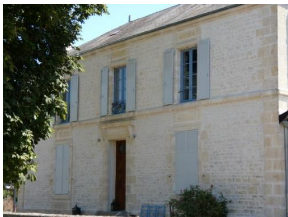
Maison de maitre ; Moulin du Château Musset (disparu), puis ferme, allées du Château

La propriété comprend un logis et d'anciennes dépendances, en partie remaniées ou démolies, au nord-est. Le logis est en retrait par rapport à la voie, derrière un jardin. Véritable maison de maître par son architecture et ses dimensions, le logis réunit un corps principal de bâtiment et une petite aile, perpendiculaire, à l'ouest. Le corps principal, haut d'un étage, est couvert d'un haut toit en ardoise et à croupes. Une corniche couronne la façade par ailleurs marquée par un bandeau d'appui et par un solin. La façade présente en outre trois travées d'ouvertures, réparties symétriquement autour de la porte centrale. Les pleins de travées sont appareillés et les encadrements des baies sont saillants. Celui de la porte est par ailleurs mouluré, sous une corniche que soutiennent deux consoles.