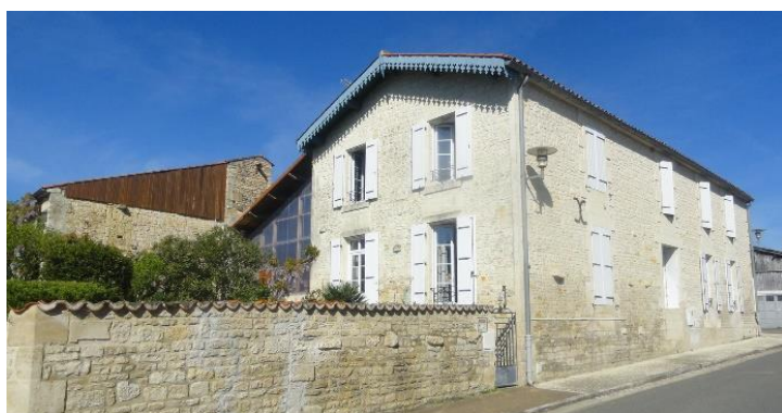
Maison inspirée de l'architecture de villégiature dans la rue du Port