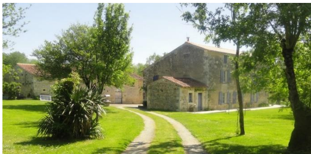
Maison de maitre ; ancienne ferme de Château Musset Datation : 17e siècle, 18e siècle, 19e siècle

Route de Damvix et ancien château Musset :