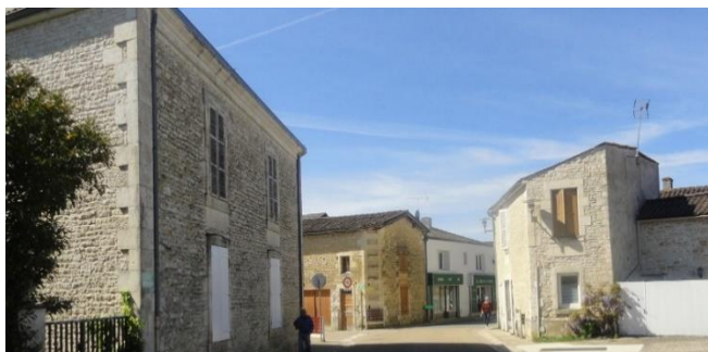
La rue principale ; un bâti dense et diversifié implanté sur rue, avec quelques pignons sur rue

La rue du Port constitue une des rues structurantes du bourg. Elle comprend quelques maisons inspirées de l'architecture de villégiature (débords de toit, lambrequin) des années 30 à 50.