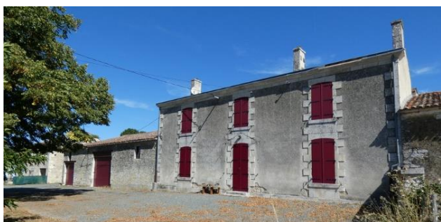
Maison de maitre ; Lieu-dit Le Moulin route de Damvix Datation : 1er quart 20e siècle

L'ancienne ferme voit se succéder un logis et des dépendances (grange, étable) dans son prolongement vers l'ouest, le tout en retrait par rapport à la voie. Le logis, haut d'un étage, a sa façade couronnée par une corniche. On y compte trois travées d'ouvertures, réparties symétriquement autour de la porte centrale. Les pleins de travées sont appareillés et les encadrements des baies sont saillants, ainsi que leurs appuis. Les linteaux sont en arc segmentaire.