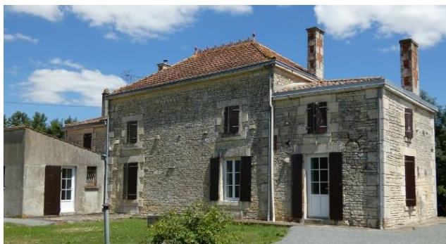
Maison de maitre ; Village de la Sèvre Datation : 1er quart 20e siècle

Cette ancienne ferme comprend plusieurs corps de bâtiments répartis sur une parcelle surélevée, au bord du bief ou canal qui relie le Village de la Sèvre au bourg du Mazeau. Le logis s'élève au sud. Au nord sont regroupées différentes dépendances, soit d'est en ouest : un hangar ou balet, une étable avec fenil, et un fournil. Une partie de leurs élévations est en bardeaux de bois. Une autre étable prolongeait le logis au nord.