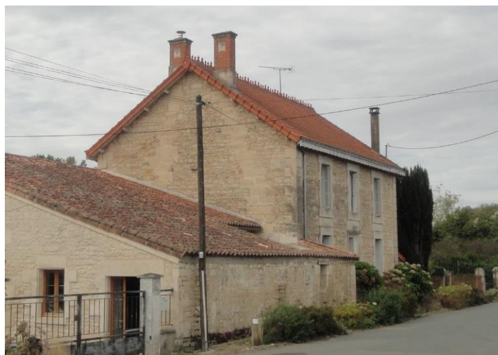
Maison bourgeoise du début du XXème avec toiture en tuiles plates mécaniques.