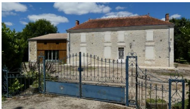
Maison de maitre ; Village de la Sèvre Datation : 1er quart 20e siècle

Cette ancienne ferme comprend un logis, en retrait par rapport à la voie, et des dépendances (notamment un hangar ou balet) dans son prolongement à l'ouest. Le logis, aux allures de maison de maître, est haut d'un étage, sous un toit à croupes et en tuiles mécaniques. Une corniche souligne ce toit que surmontent des épis et une crête de faîtage. La façade, encadrée par des pilastres, présente quatre travées d'ouvertures. Les encadrements des baies sont saillants et les linteaux sont en arc segmentaire.