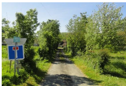
Petites prairies et maillage bocager aux abords du hameau du Bas des Eaux, un écrin de qualité au hameau.