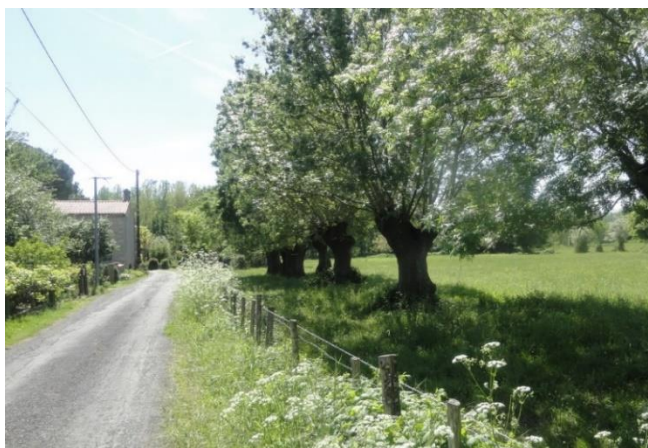
Paysage bocager de grande qualité aux abords du bourg, annonçant le marais et offrant de belles fenêtres paysagères

La préservation des vues les plus remarquables et des composantes paysagères (haies, frênes têtards, prairies) constitue un enjeu important pour préserver la qualité du bourg et de ses abords.