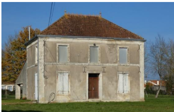
Maison de maître de la fin du 19e siècle, route de Benet – Le Bourg

La maison est située en retrait par rapport à la voie, entre un parc arboré et un pré. Des communs lui sont adossés à l'arrière. Haute d'un étage, elle est couverte d'un toit à croupes, en tuiles mécaniques, souligné par une corniche et orné d'une crête et d'épis de faîtage. La façade, ordonnancée, est marquée par un solin et un bandeau d'appui. Elle compte trois travées d'ouvertures. Les encadrements des baies sont saillants.