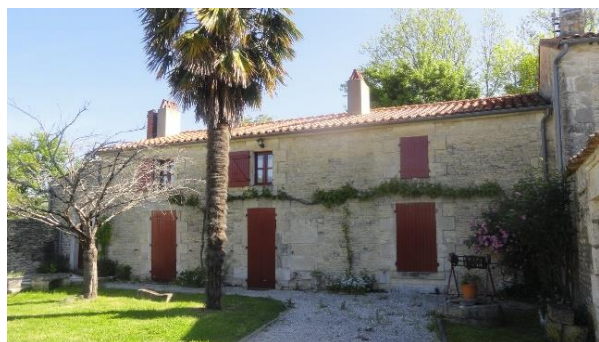
Maison rurale bien restaurée dans la rue du Port. La façade aurait cependant nécessité un enduit plus couvrant arrivant au nu des pierres de taille