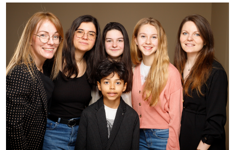
Séance photo avec le CMJ 9 mars