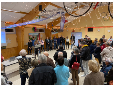
Cérémonie des vœux 5 janvier