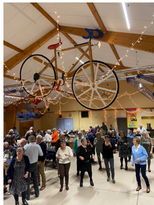
Repas du CCAS 7 janvier