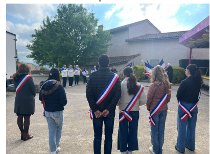
Commémoration du 8 mai