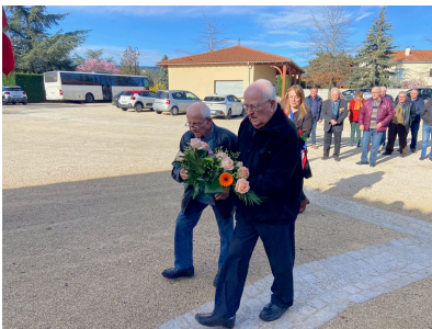
Commémoration du 19 mars