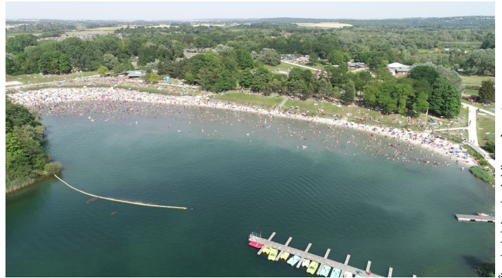
Île de loisirs de Jablines-Annet

La chaleur, on y croit ! Ici la plage en août 2023.