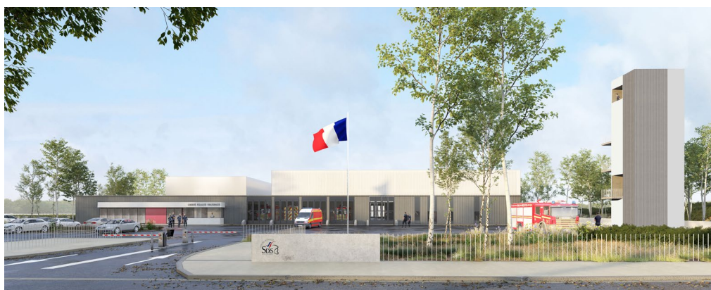
Le futur centre d'incendie et de secours à l'entrée Est de Lagny

travail, celui du domicile et celui de l'activité au centre, il faut bien en rapprocher au moins deux pour servir efficacement.