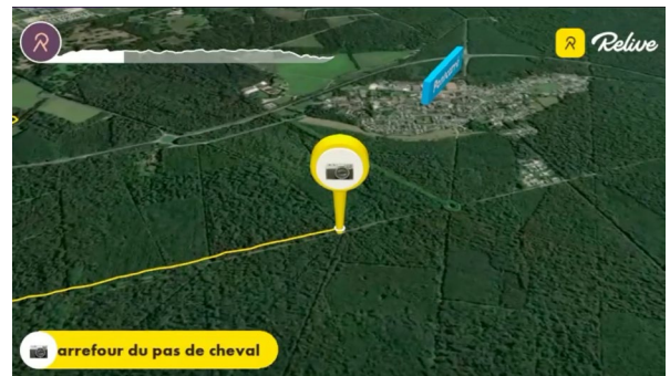
Gwenaël Couïc- 4 mai 17:33

La photo du Marne et Gondoire Hebdo a été prise sur la commune de Pontcarré, à la limite de Croissy-Beaubourg, au Carrefour du Pas de Cheval. Sur la gauche du panneau indicateur, la mention «Allée du Tour du Parc de Croissy» a été biffée. (...)