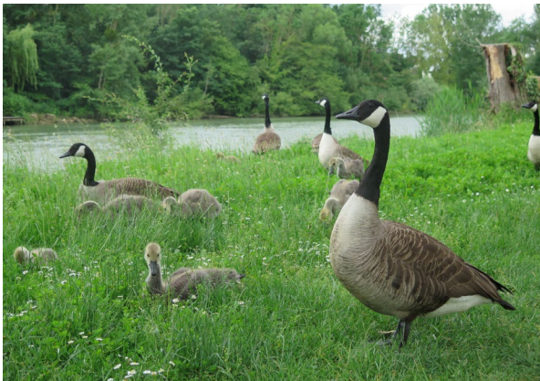
Peu intéressées par l'histoire des guinguettes, les oies bernaches profitent paisiblement des bords de Marne à Dampmart le 5 juin