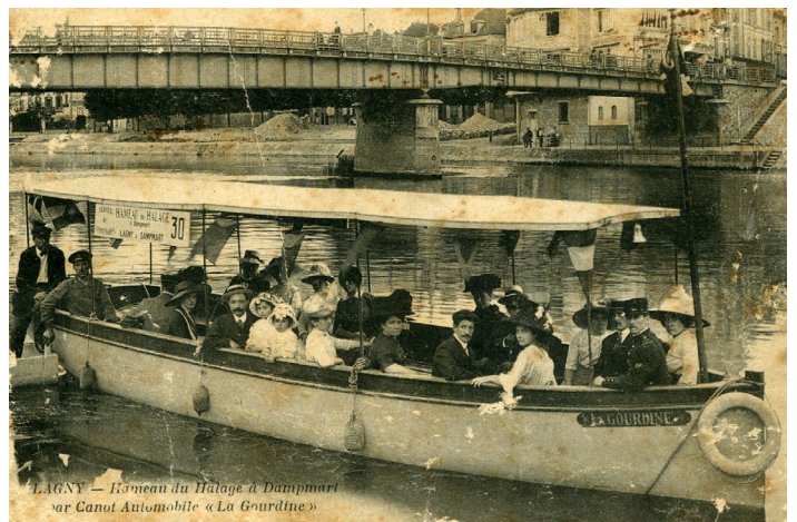
Embarquement pour Dampmart à l'emplacement actuel de la Halte-fluviale à Lagny