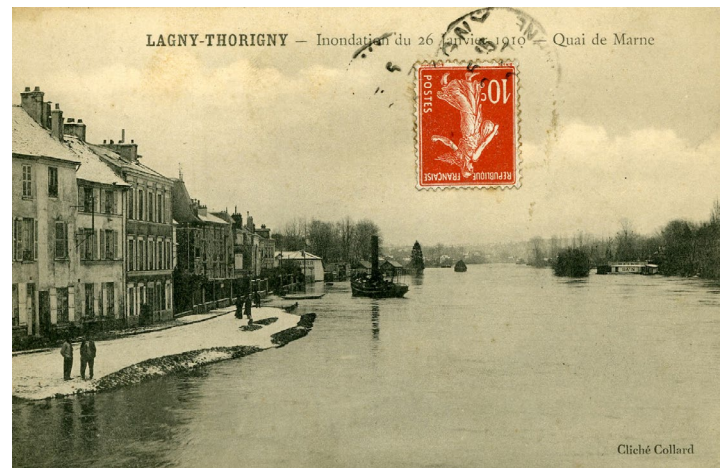
La crue de 1910 à Lagny, quai de Marne côté Thorigny

La découverte de l'histoire des bords de Marne continue le samedi 22 juin avec une promenade commentée de 3 kilomètres sur l'ancien chemin de halage entre Chalifert et la passerelle de la Dhuis. Départ à Chalifert devant le cabaret de l'Ermitage.