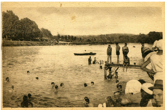
Baignade à Montévrain, en face de Dampmart