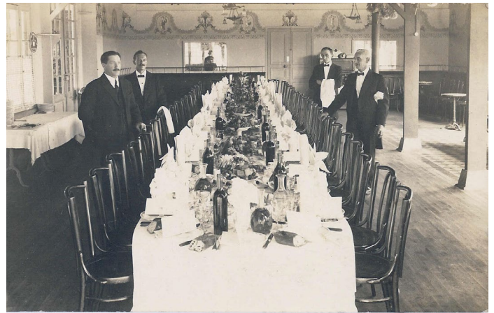
Un banquet à la maison Chambrey