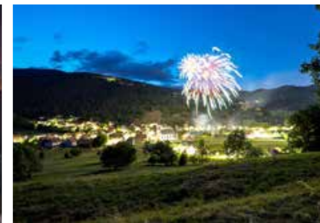
Le feu d'artifice clôturant la célébration de la Fête Nationale.