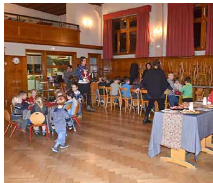
Le moment du goûter.