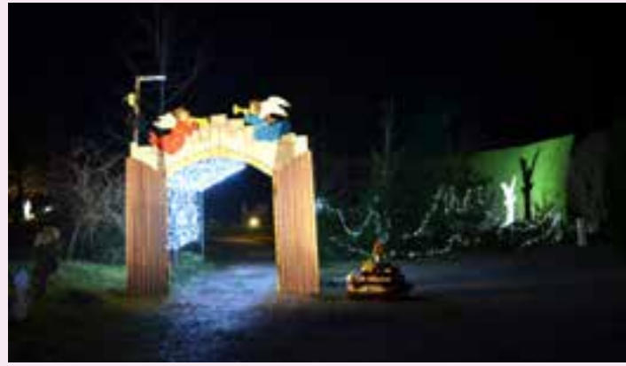
L'entrée du Sentier de Noël du Silberwald.