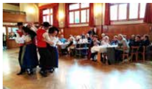
Le spectacle de danse.