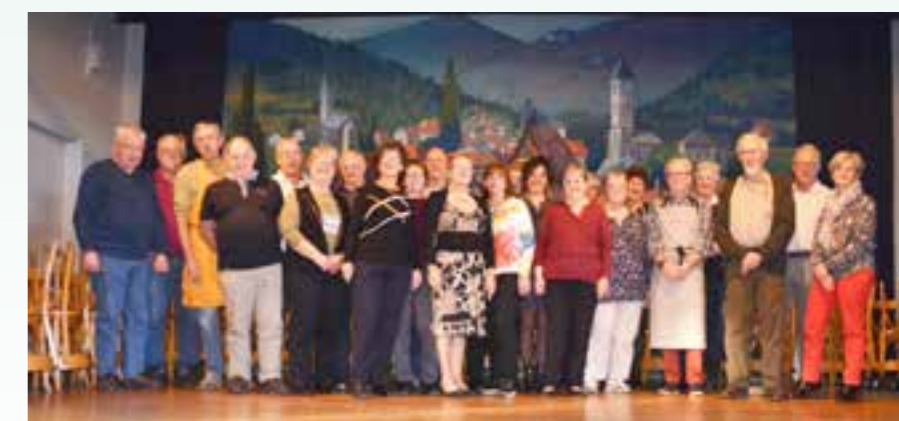
Les bénévoles qui ont œuvré pour la réussite de cette journée.