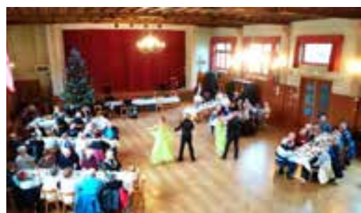
La chorale improvisée.

Pour ceux qui souhaiteraient participer aux activités du Club de l'Amitié, celles-ci se déroulent le dernier mercredi après-midi de chaque mois hormis les périodes estivales à partir de 14 h 00 à la Salle des Fêtes de Stosswihr. Pour plus d'amples renseignements vous pouvez contacter la présidente Mme Lilly HEINRICH au 03 89 77 41 70