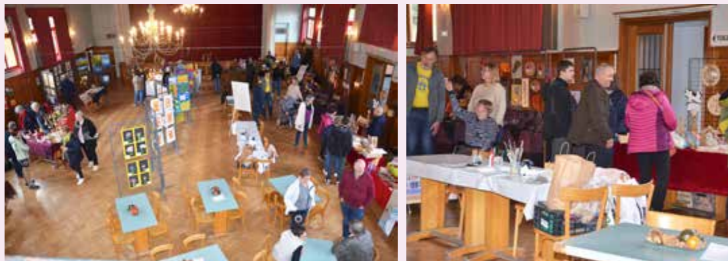
Les visiteurs étaient curieux de voir les réalisations des uns et des autres.