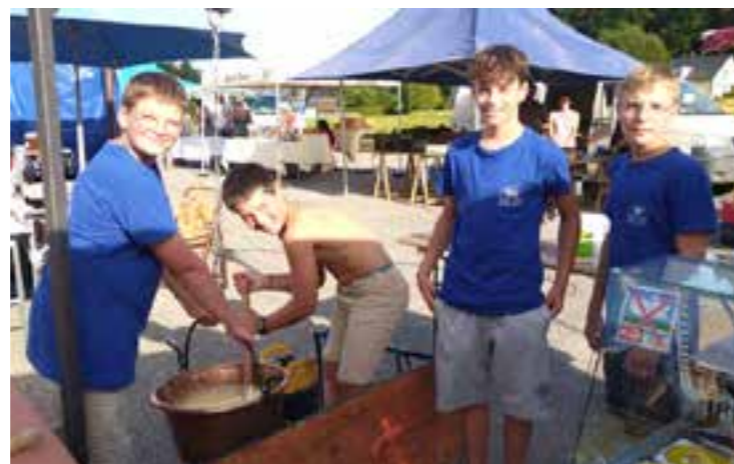
Le groupe de jeunes en action.