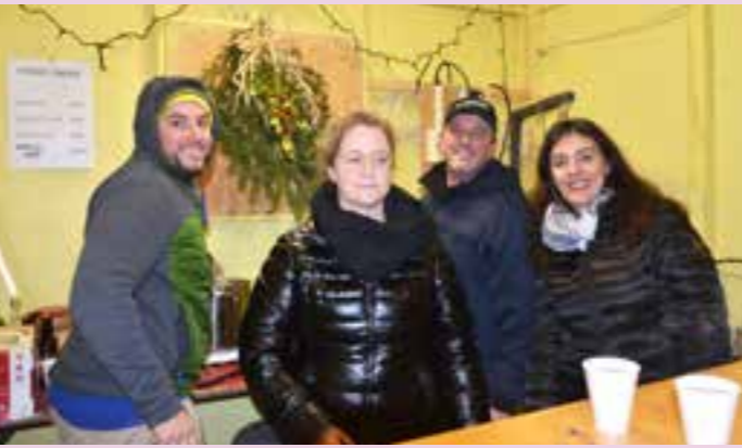
Le stand de vin chaud à la chapelle du Schweinsbach.