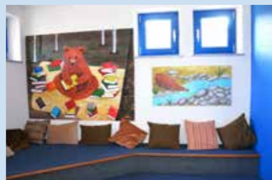
Les fresques réalisées par le Club Caméléon