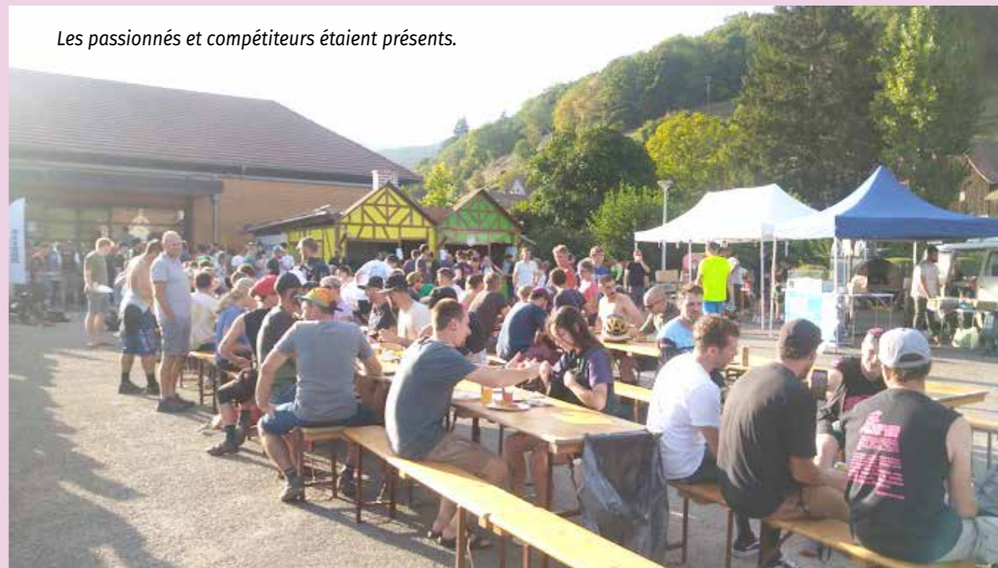
Les passionnés et compétiteurs étaient présents.