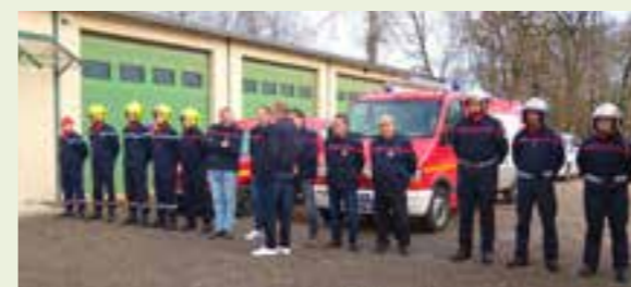
La haie d'honneur composée des sapeurs-pompiers de Ste Croix en Bresse et de la délégation du corps « Petite Vallée ».