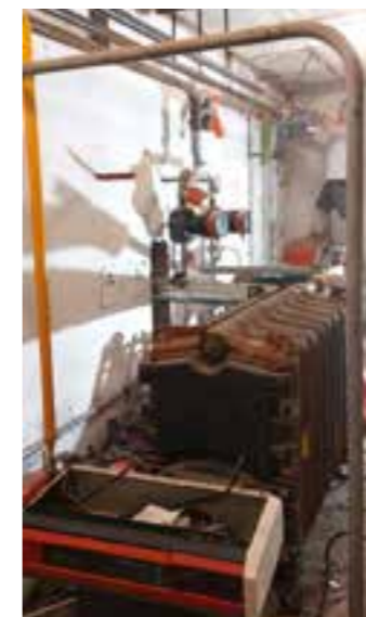
L'ancienne chaufferie en phase de démantèlement