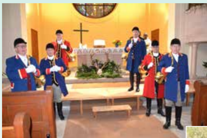
Les sonneurs de l'Echo du Gang de St Amarin, en tenu de cérémonie.

Tout au long du repas, la convivialité était de mise et animée entre autres par les interventions musicales des sonneurs de cors de chasse. Cette journée de partage a été une belle réussite.