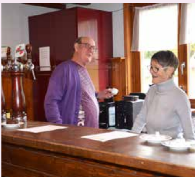
Les bénévoles du Club Caméléon qui ont assuré la petite restauration.