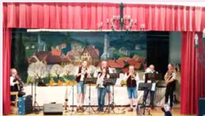
Les « Frankenthäler ».