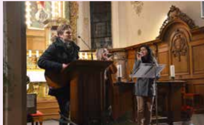
Concert à l'église Catholique par des jeunes artistes devant un public très attentif.