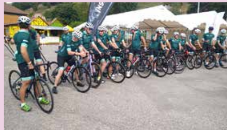
Les invités du sponsor SKODA sur la ligne de départ.