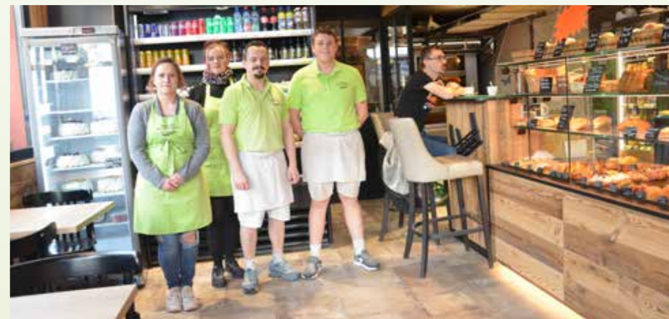
L'équipe du Petit Schlitteur.