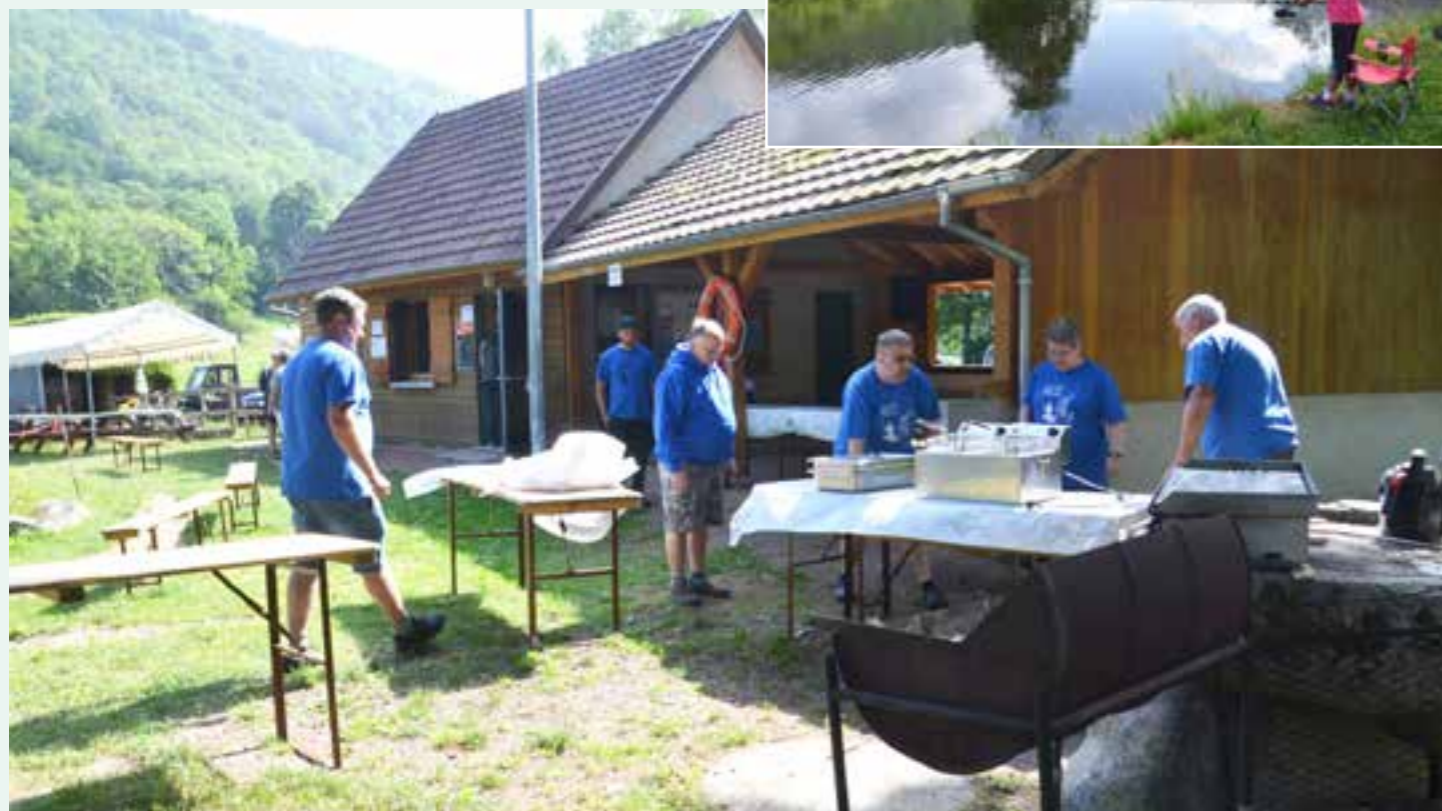
Les membres de l'APP préparant les grillades

À midi, tous ont profité de l'excellent repas préparé par les membres de l'association de pêche de Stosswihr. Après le déjeuner, les adultes ont pris le relais autour de l'étang.