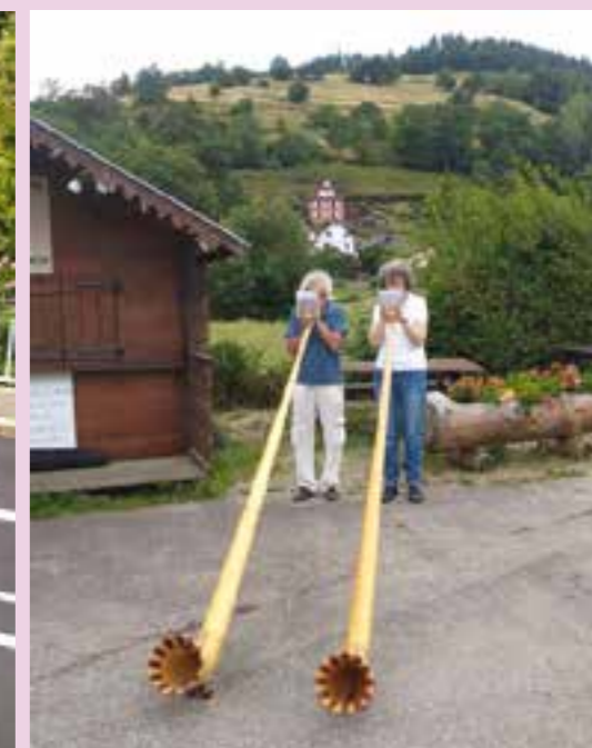
Animation musicale par les Cors des Alpes.