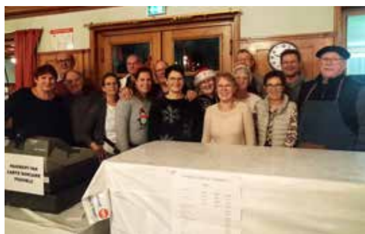
La restauration à la Salle des Fêtes était assurée par les membres du Comité des Fêtes.