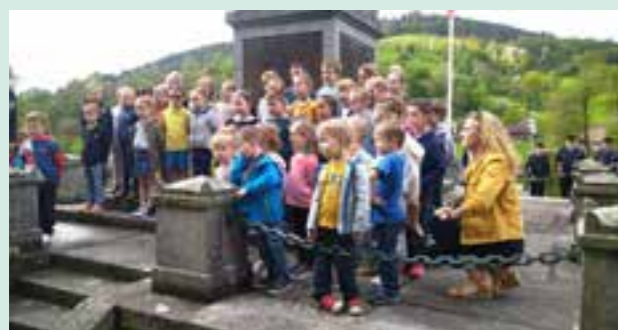
Les écoliers entonnant leur chant.

Tout le monde s'est retrouvé ensuite vers la Salle des Fêtes, autour du verre de l'amitié offert par la municipalité.