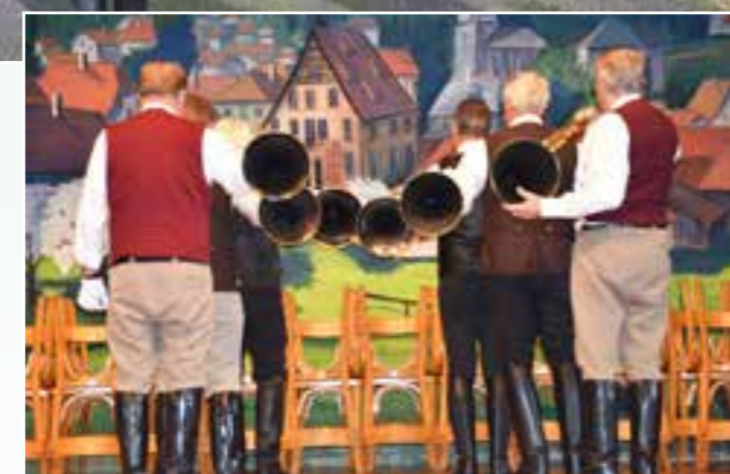
Les sonneurs de l'Echo du Gsang de St- Amarin à l'œuvre.