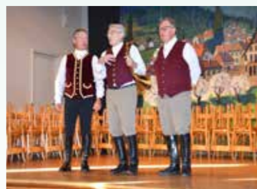
Le public a découvert les talents de chanteur des sonneurs.