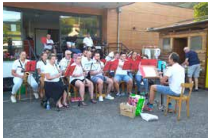
Animation musicale par l'Harmonie Petite Vallée.

Quant à l'animation musicale, elle était assurée par l'Harmonie de la Petite Vallée ou les Cors des Alpes.