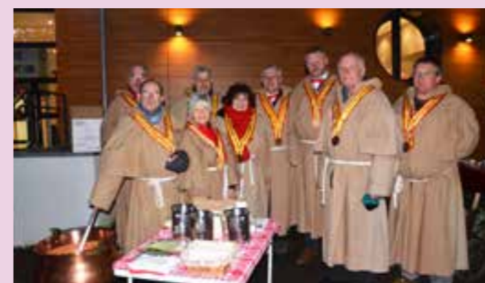
La confrérie St Grégoire du Taste Fromage de la Vallée de Munster qui a distribué la soupe au Munster.