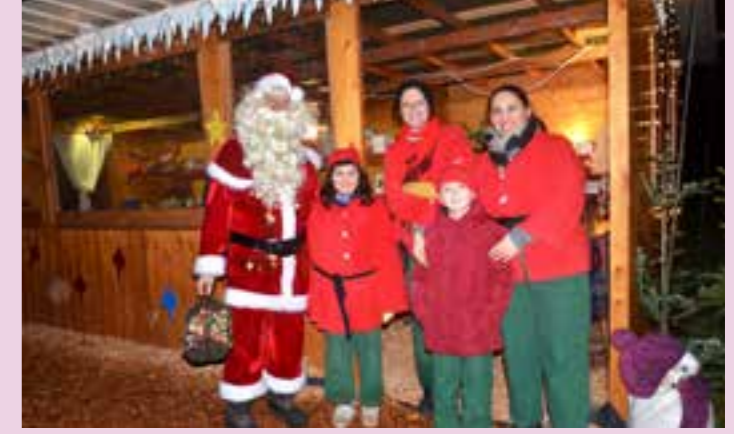
Le Père Noël entouré par les lutins.