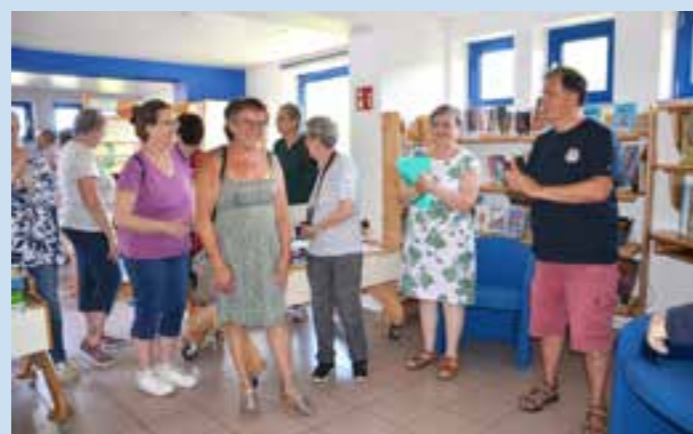
Lors de l'inauguration des locaux rafraîchis : les présidentes des 2 associations et le Maire

Ces travaux ont été accompagnés par la création de fresques par le club artistique Caméléon de Stosswihr. Quand les associations réunissent leurs idées et leurs forces dans un projet commun, on peut aller plus loin.