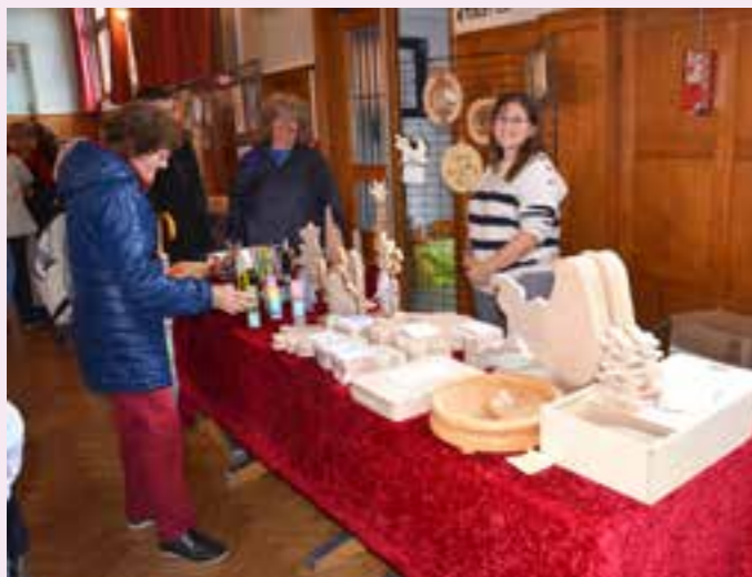
Mme CLAUDEL : objets de décoration en bois.