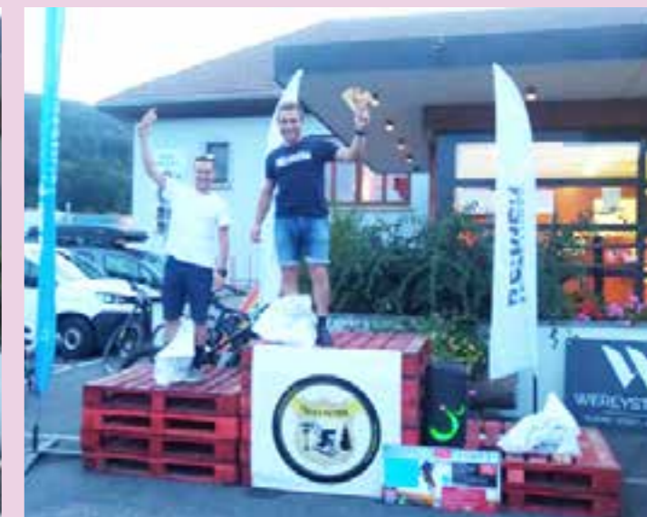
Remises de prix aux lauréats.