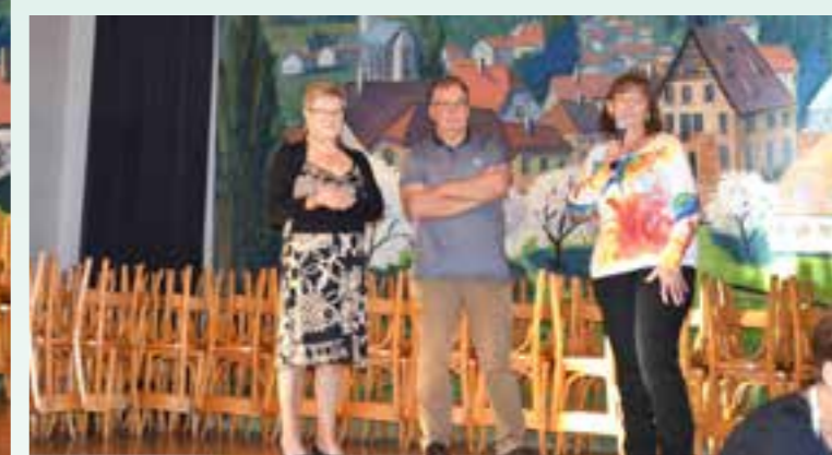
Le Maire et les représentantes des 2 paroisses lors de la prise de parole.