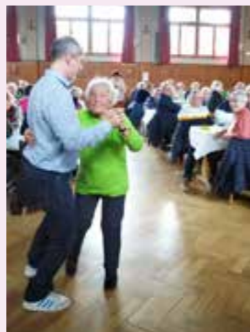
Un pas de danse.