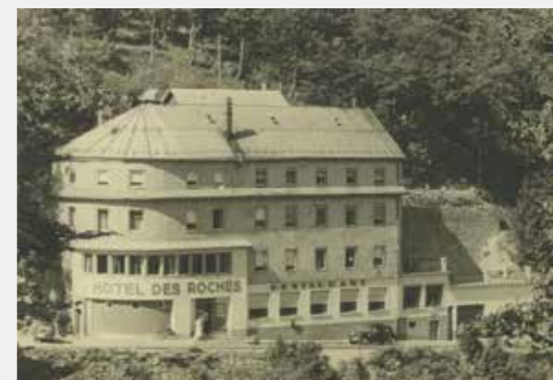
L'hôtel-restaurant lors de sa splendeur