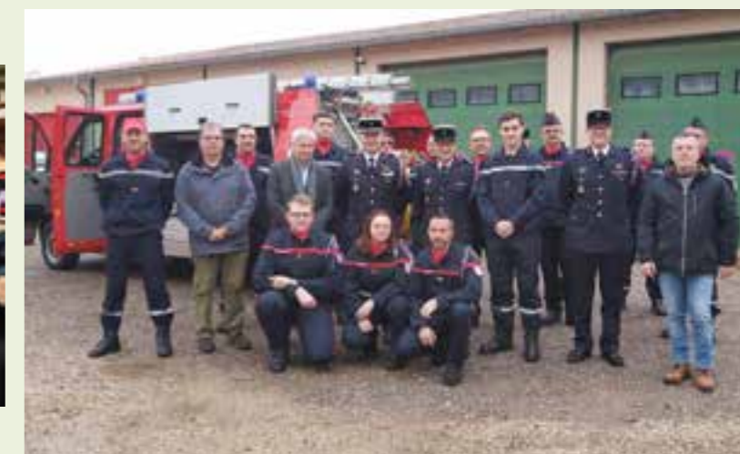
La délégation de Stosswihr avec les élus et sapeurs-pompiers locaux.