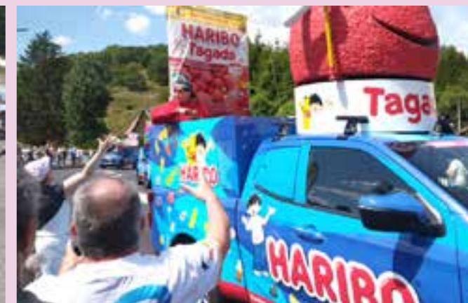
La caravane publicitaire rencontre toujours du succès.