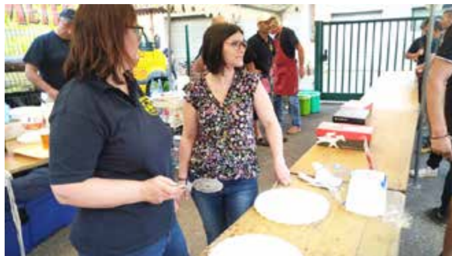
Pas de temps morts pour les amicalistes et leurs conjoints.