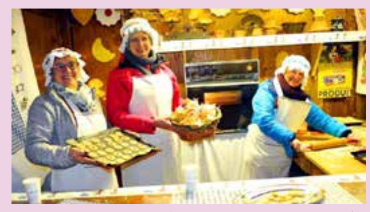
Nouvelle attraction «s'brédalahissla» : fabrication et dégustation de petits gâteaux de Noël par le club Caméléon.