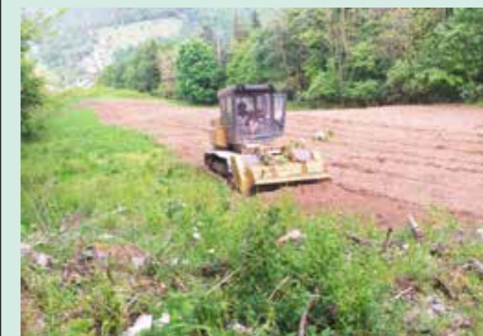
Durant les travaux de préparation du sol.