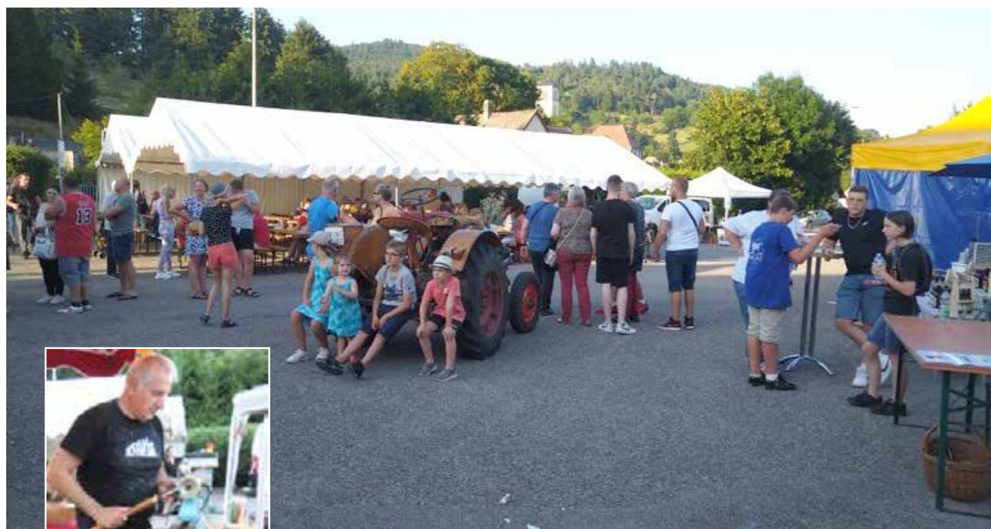
Jeunes et moins jeunes était présents.