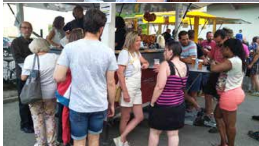
La foule se pressait tant sous les tentes ou au barnum.