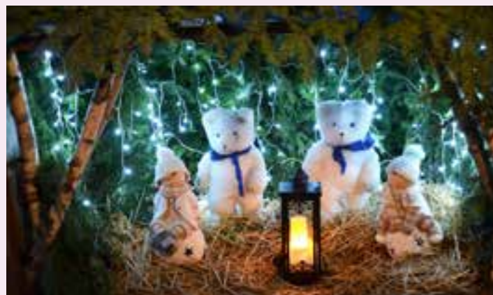
De belles décorations réalisées par des habitants.