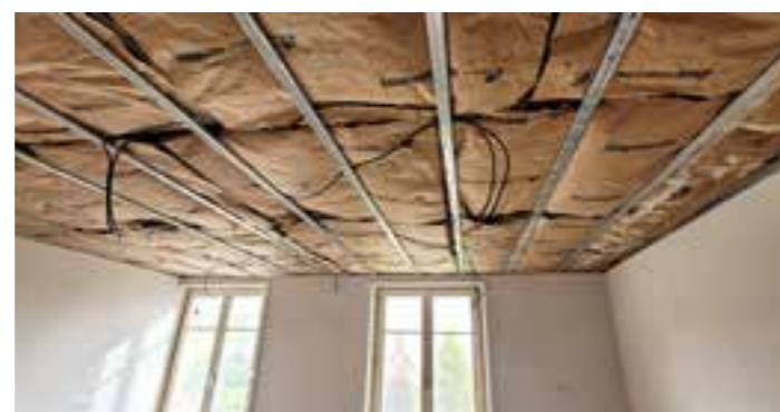
Les travaux d'isolation