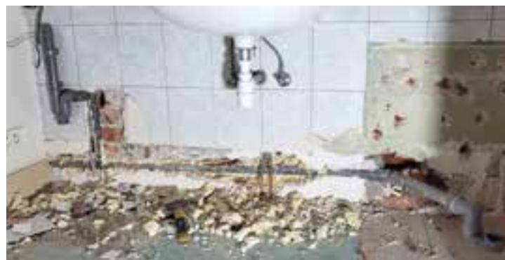
Les travaux de sanitaire en cours