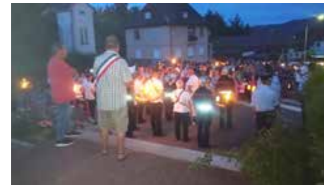
Le cortège devant la mairie, à l'écoute du discours du Maire.