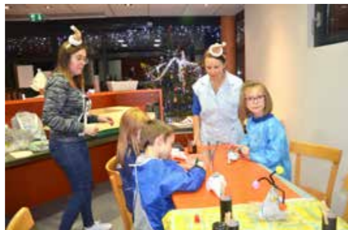
Une autre nouveauté à la Salle des Fêtes : l'atelier de bricolage pour les petits, animé par l'association des Parents d'Elèves.