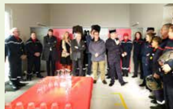
Durant les discours des officiels.