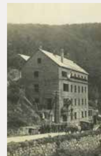
La reconstruction après la 1 ère guerre mondiale