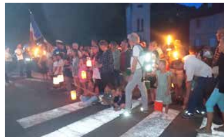
Le défilé à travers les rues du village.