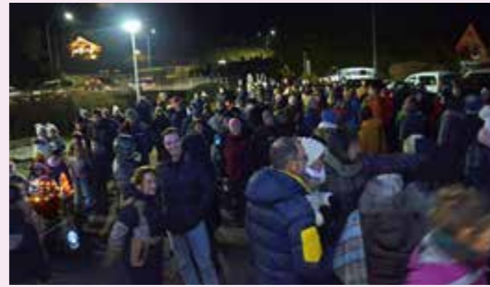
Les visiteurs étaient fort nombreux.