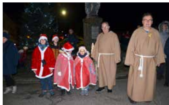
Les moines « guides » accompagnés des lutins.