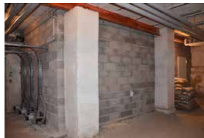
Derrière ce mur est logé le silo à pellets