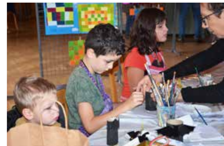
L'atelier de peinture et de bricolage, animé par le Club Caméléon, a connu un vif succès auprès des enfants.