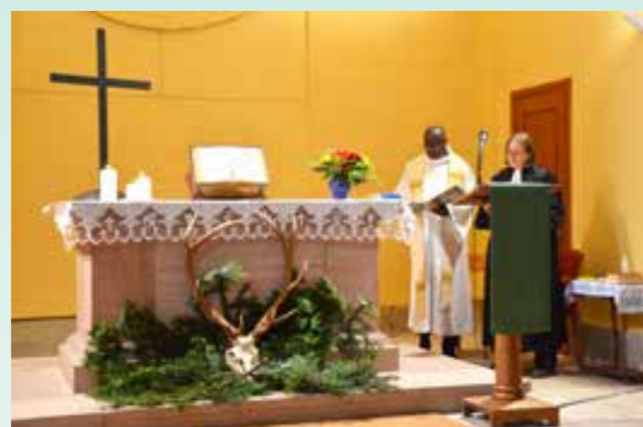
L'autel décoré par les chasseurs.