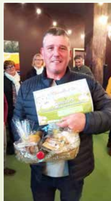
Toute l'équipe, fière des distinctions obtenues.