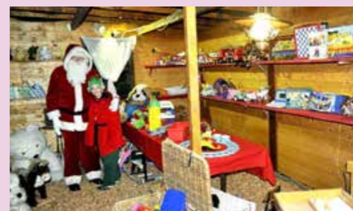
La fabrique des jouets.