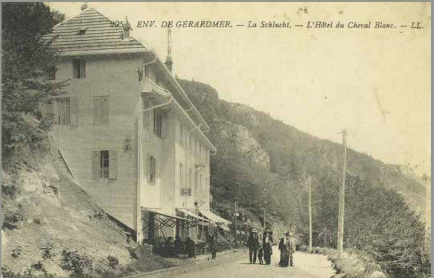
295 ENV. DE GÉRARDMER. — La Schlucht, — L'Hôtel du Cheval Blanc. — LL.