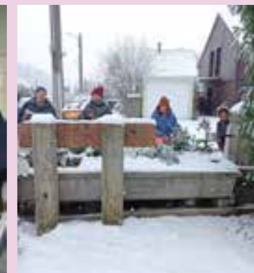
Des bénévoles à leurs postes et très actifs.