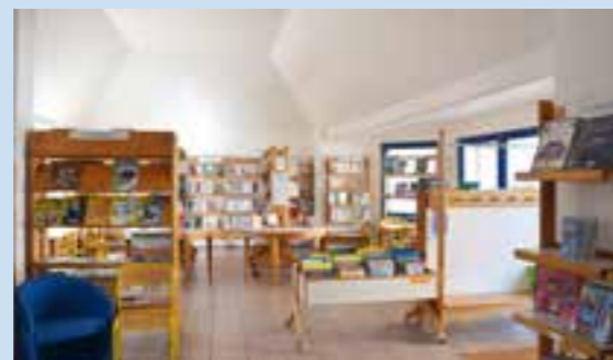
La bibliothèque après rafraîchissement des locaux