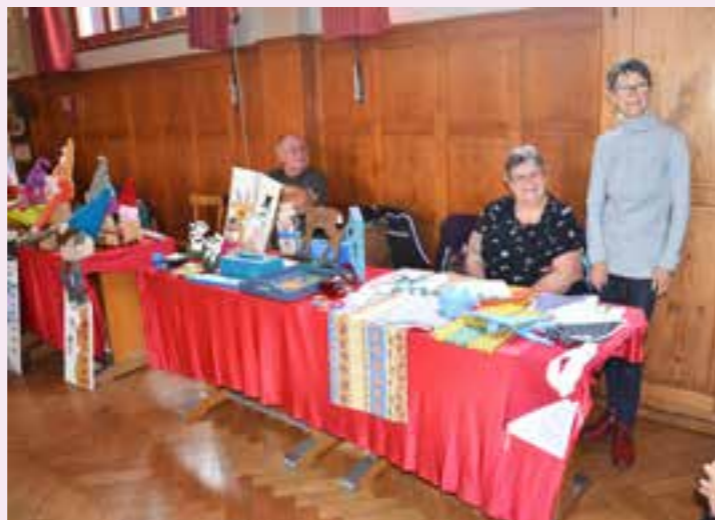
Le stand du Club Caméléon.