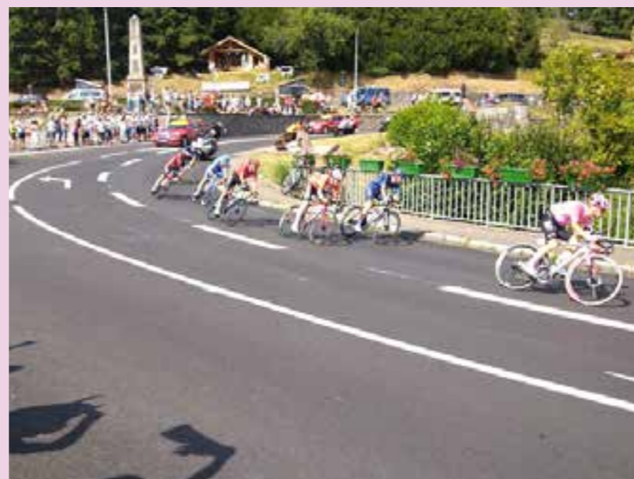
Le passage des coureurs.

Quant au Comité des Fêtes de Stosswihr, il proposait au public de quoi se restaurer tout au long de cette journée.