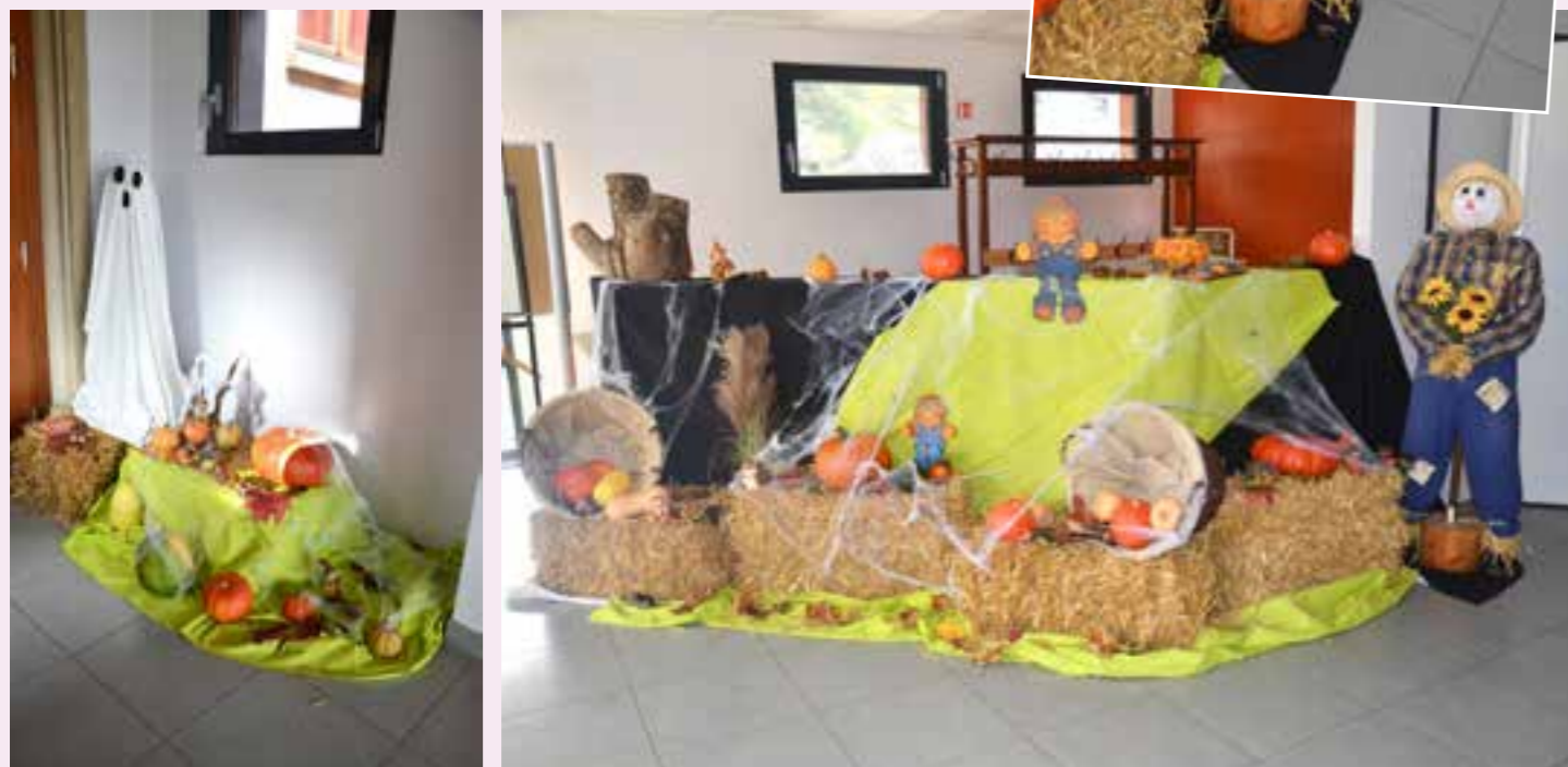
L'entrée de la Salle des Fêtes décorée par les membres du Club Caméléon.