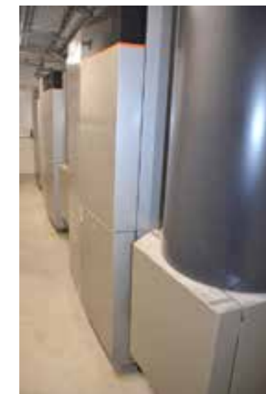
La nouvelle chaufferie