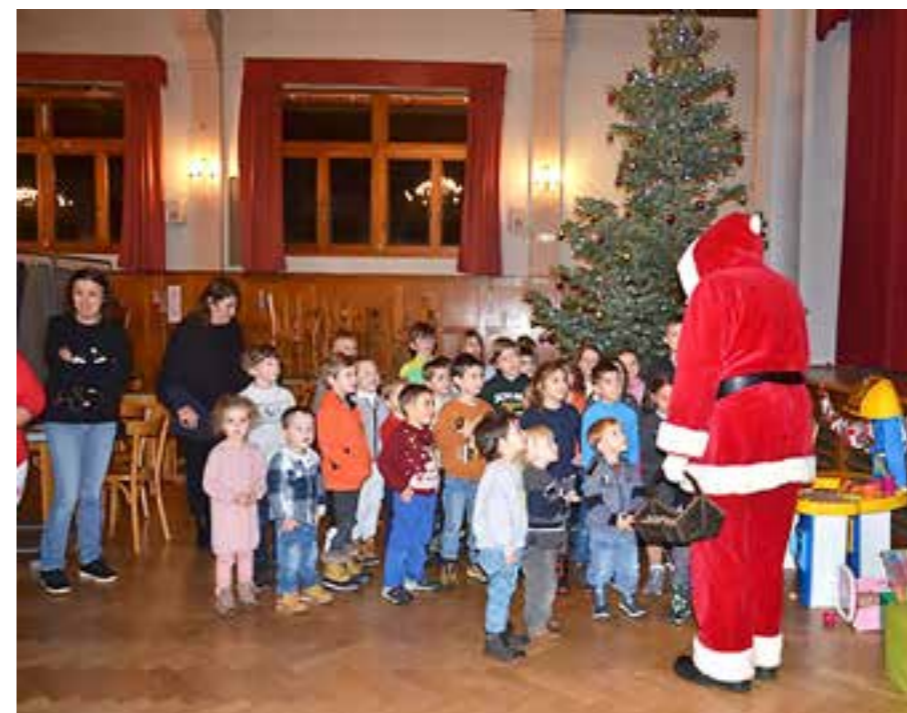
Les enfants à l'écoute du Père Noël.

Grande surprise, le Père Noël s'est invité à la fête et il n'est pas venu les mains vides: il a distribué un petit cadeau à chacun des enfants. Ces cadeaux ont été offerts par le Comité des Fêtes de Stosswihr. Quant aux enfants, ils n'ont pas hésité à entonner leur chant favori « petit papa Noël ».