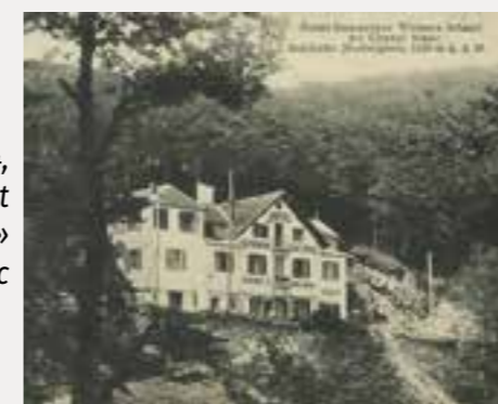
Avant 1914, Hôtel-Restaurant « Weisse Rössel » Au Cheval Blanc

Néanmoins il était intéressant de remonter le temps et de connaître un peu l'histoire et l'évolution de ce bâtiment.