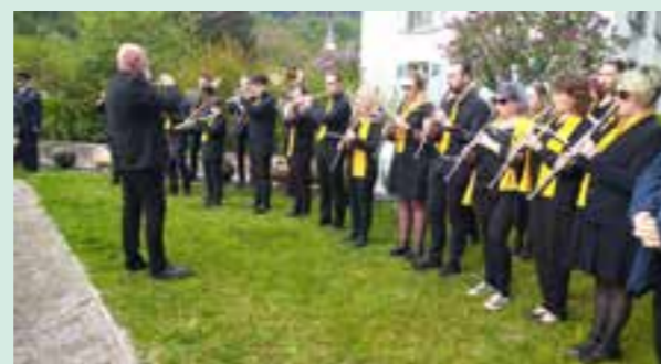
L'Harmonie Petite Vallée.