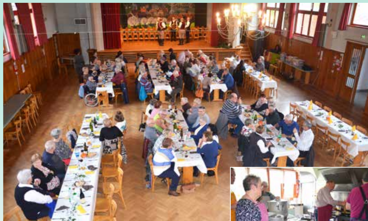
Les convives à table.