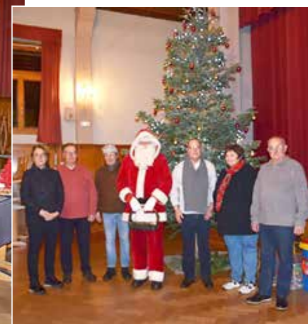
Le Père Noël entouré des élus et des membres du Comité des Fêtes.