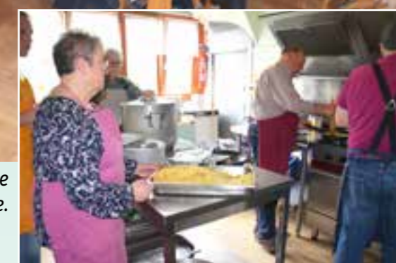
Les bénévoles en pleine action à la cuisine.