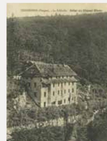
Immeuble endommagé lors de la 1 ère guerre mondiale