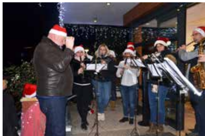
L'Harmonie Petite Vallée qui a assuré l'accueil musical.