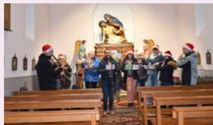
Intermède musical par l'Harmonie Petite Vallée, à la chapelle du Schweinsbach.