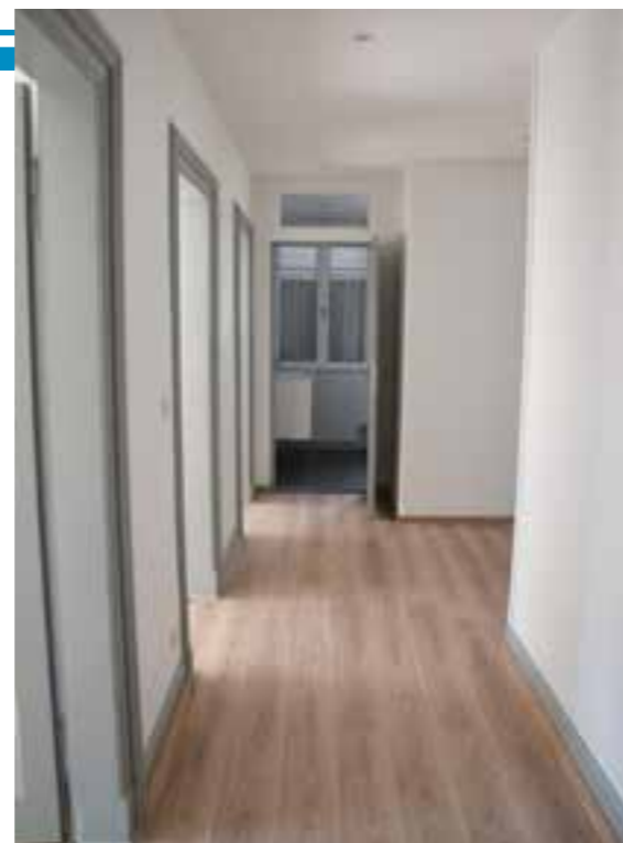
Un appartement, après travaux

La municipalité a profité de l'occasion pour mener une rénovation complète qui passait par une isolation thermique des locaux mais aussi par une transformation des salles de bains, des cuisines et de la réfection des sols et des murs ainsi qu'une mise aux normes de l'installation électrique. Une grande partie des travaux a été réalisée en régie, mais également, après consultation, par des entreprises: SA OBERLE KORUS pour la partie maçonnerie, MONAMI ET FILS SARL pour le carrelage, LEGENTIL pour la partie isolation et plâtre et EGH pour la partie électrique qui sont toutes des entreprises installées à Stosswihr et BRUNN de Munster pour la partie sanitaire.