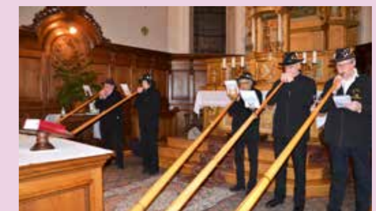
Les Cors des Alpes toujours présents.