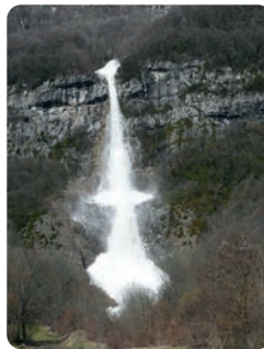
AVALANCHE DE PLAN CRUET