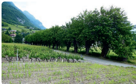
LE CHEMIN DES MÛRIERS