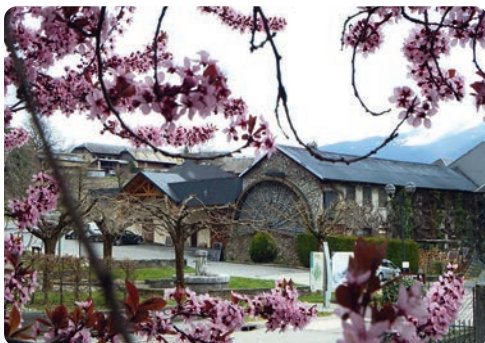
LA GRANDE ROUE