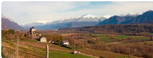
LE DOMAINE DU CHÂTEAU DE LA RIVE AVEC AU FOND LE GRAND ARC (2484 M)

Continuer sur D201 au hameau la Baraterie.