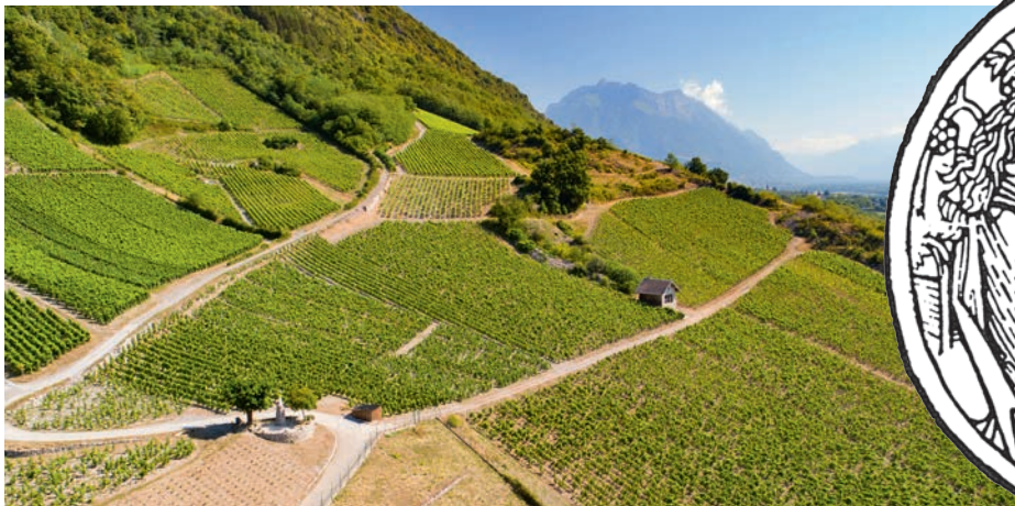
LE VIGNOBLE D'ARBIN

Ici, la vigne produit très bien et depuis très longtemps. Des auteurs tels que Pline et Columelle en font déjà état au 1 er siècle avant J.C. Depuis et jusqu'à notre époque contemporaine, ce fut la création puis, après les ravages du phylloxéra, la renaissance du vignoble savoyard par la mise en valeur des procédés de culture, la quête de la qualité. Ce terroir historique est donc un espace représentant la conjonction d'un sol, d'un climat donnant ainsi un caractère unique au raisin récolté et aussi du travail des vignerons gardiens du temple.