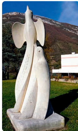
PLACE ALBERT SERRAZ

Montmélian, est placée au carrefour de la Combe de Savoie, du Grésivaudan et de la Cluse de Chambéry. Déjà à l'époque antique, la voie romaine longeait les coteaux le long de la rivière Isère et passait à hauteur de Montmélian en direction de Lemencum (Chambéry). Le croisement des voies de communication explique son implantation et le développement très ancien d'une place fortifiée. Avec un emplacement aussi stratégique, elle subit plusieurs sièges savoyards, français, espagnols. La cité au pied du fort est enserrée dans ses remparts du moyen âge. Une visite s'impose.