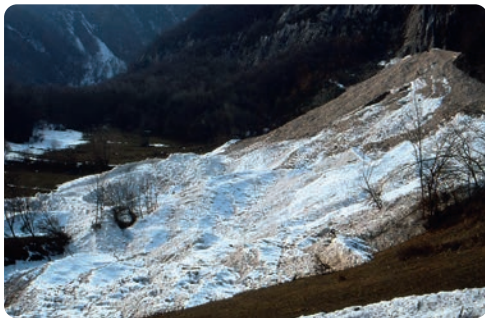
NÉVÉ DE PLAN CRUET