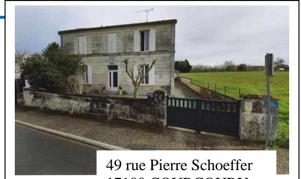
49 rue Pierre Schoeffer 17100 COURCOURY