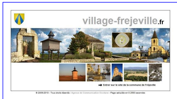
Page d'introduction du site