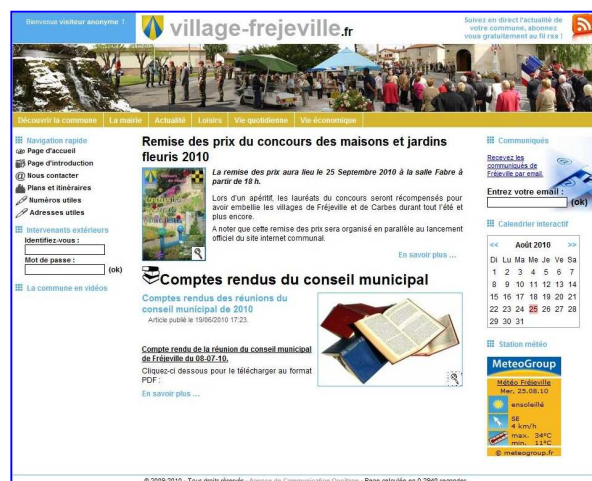
Page d'accueil du site

Par la suite, ce sont les responsables de la communication, les secrétaires, mais aussi les associations qui tiendront le site à jour.