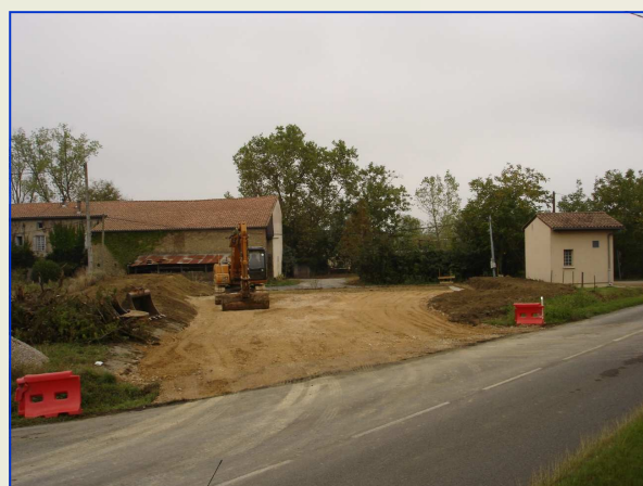
Début du terrassement