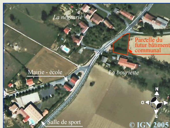
Situation sur carte

Le terrassement a débuté depuis fin septembre 2009.