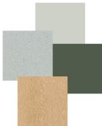
Proposition de planche de matériaux 1