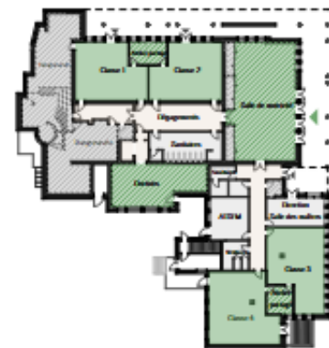
2 - Scénario principal avec ateliers partagés