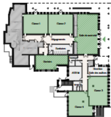
1 - Scénario principal