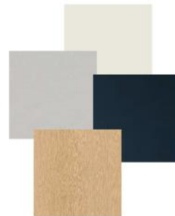
Proposition de planche de matériaux 2