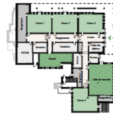
3 - Variante de projet