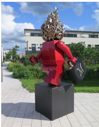
Corinne Dechaume - 18 juin 10:41

Montévrain, place des Libertés. Inaugurée le 25 mai 2024, « A venir » est une œuvre de l'artiste Frédéric Avella, représentant un personnage en lego rouge portant une valise « M » (comme Montévrain) avec une tête de papillons dorés. Une statue pour incarner l'avenir, la construction, la transformation et le mouvement.