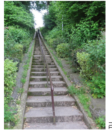
Gwenaël Couïc - 24 juin 19:36

visons également le marché alimentaire.» Outre les cuves de conservation, cryopal installe également des salles cryogéniques clefs en main et en assure la maintenance. «Nos clients sont des laboratoires et des biobanques qui ne veulent pas avoir à gérer cet équipement. Ils veulent simplement être certains que la température est parfaitement stable.» Alors, Cryopal a fait breveter un système de télésurveillance. «Ce sera une preuve pour les chercheurs que les produits servant de bases à leurs analyses n'auront pas été affectés par la moindre variation de température.» Cryopal y voit aussi un axe de développement de son activité dans la télésurveillance et la télémédecine.