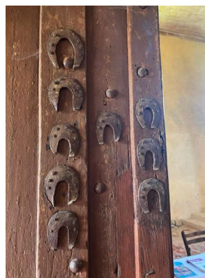
Corinne Dechaume - 18 juin 10:41

(...) un petit Lego de 700 kg qui va de l'avant !