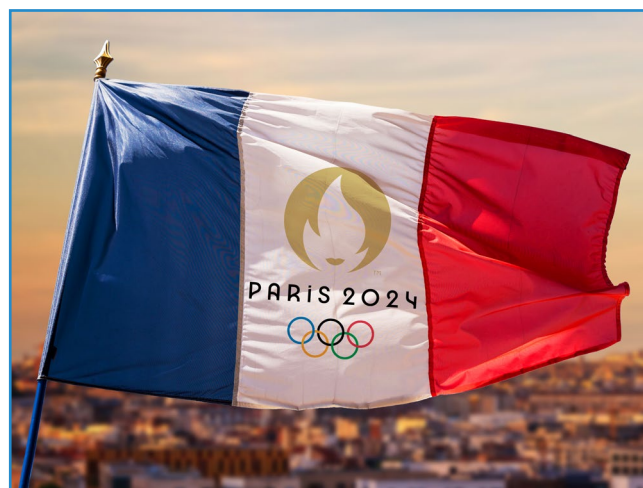
Les présidents de club parlent des JO