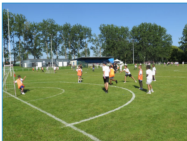
Le tournoi de handball intercommunal