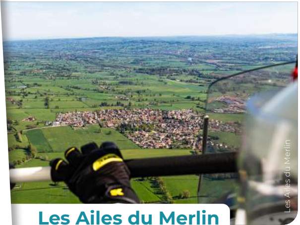
Les Ailes du Merlin