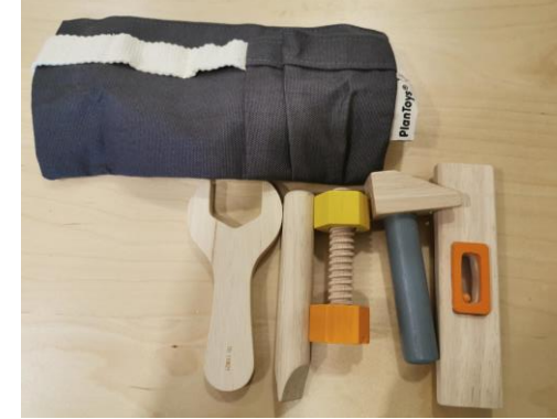
1 ceinture à outils (7 pièces)