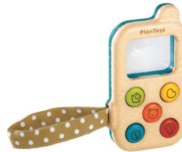
2 téléphones portables