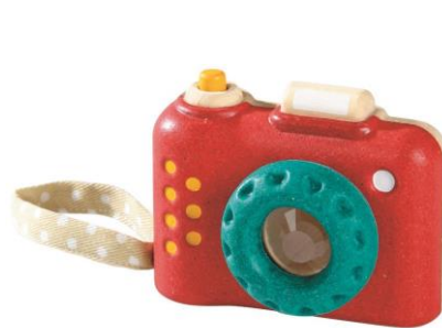
2 appareils photos