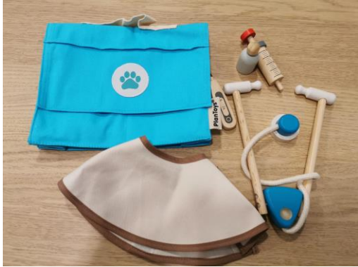
1 mallette vétérinaire (8 pièces)