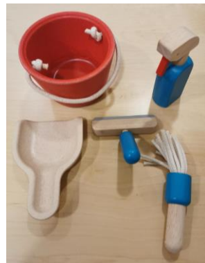
1 set d'entretien (5 pièces)