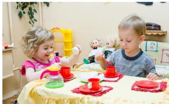
Une charte sur les jouets pour combattre les stéréotypes de genre dès l'enfance

En 2017, Emmanuel Macron avait proclamé l'égalité entre les femmes et les hommes « grande cause du quinquennat ». Et c'est dès la petite enfance en luttant notamment contre les stéréotypes de genre que le gouvernement souhaitait agir. Dans cette lignée, une Charte pour la représentation mixte des jouets ( https://lesprosdela petiteenfance.fr/stereotypes-de-gendre-signature-dune-charte-pour-la-representation-mixte-des-jouets ) a été signée en septembre 2019 par les acteurs du secteur des jouets (fabricants, distributeurs, associations...). A quelques mois de Noël, une version actualisée de la Charte vient de voir le jour. Grande nouveauté : les principaux acteurs des modes d'accueil individuel et collectif du jeune enfant ont été invités à la signer.