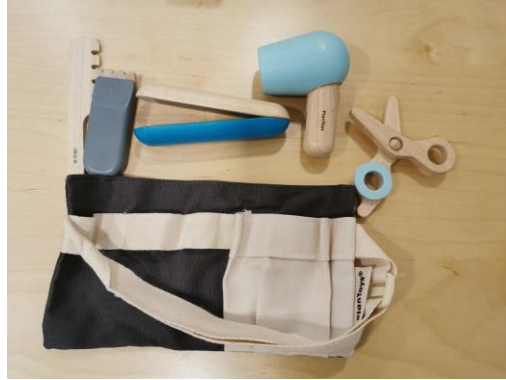
1 trousse de coiffure (6 pièces)