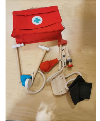
1 mallette docteur (6 pièces)