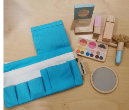
1 trousse maquillage (10 pièces)