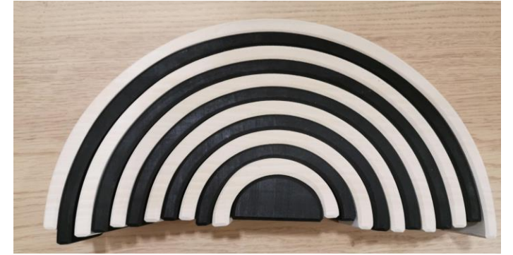
1 arc en ciel monochrome (12 pièces)