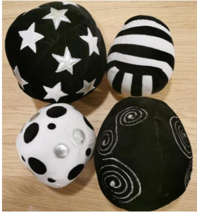
4 balles noires et blanches