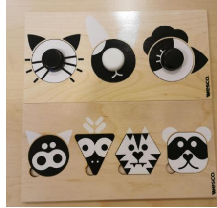
2 puzzles (3 pièces + 4 pièces)