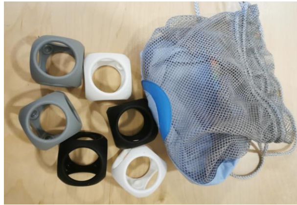
6 cubes contrastés + 1 sac