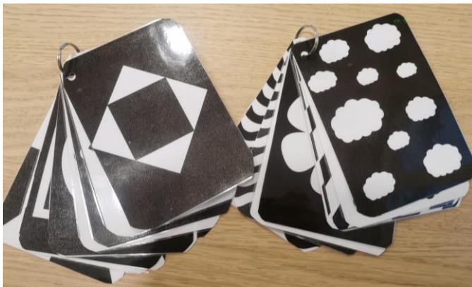
2 imagiers en papier