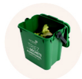
Un bio-seau (7 l) pour trier vos déchets alimentaires à domicile.

Saint-Étienne Métropole vous aide à valoriser vos déchets alimentaires pour enrichir les sols de votre jardin en fournissant gratuitement :