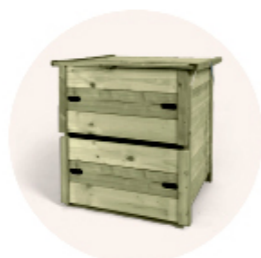
Un composteur (400 l) pour faire votre compost dans un coin de votre jardin.