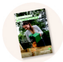
Un guide du compostage pour savoir comment bien composter (à retrouver aussi sur saint-etienne-metropole.fr).