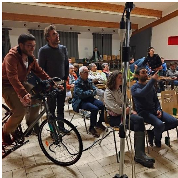
Fête des tourbières à Frasne

Retrouvez nos prochains RDV sur notre agenda en ligne.