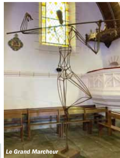
Le Grand Marcheur