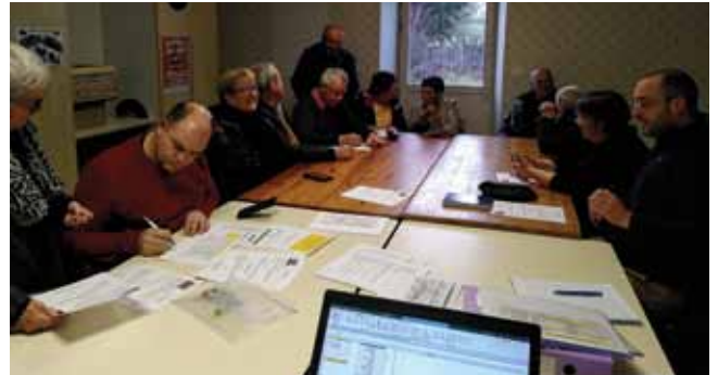
Assemblée générale du 27 janvier 2024

Pour cette année, 7 animations sont prévues telles qu'indiquées dans le flyer distribué avec la dernière gazette. Nous avons hâte de vous y retrouver.