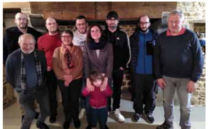
Les membres du bureau 2024