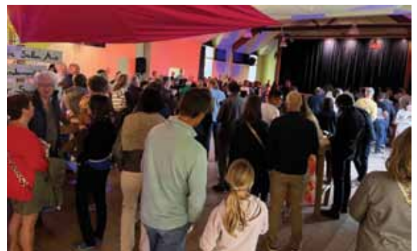
Soirée salsa, initiation

L'organisation a été plébiscitée par tous les participants car ils y ont vu l'investissement en décoration et en restauration ; les pennés ont fait un carton.