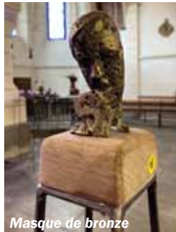
Masque de bronze