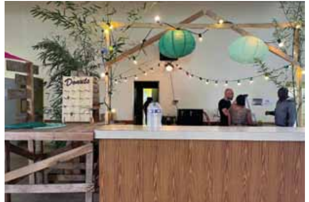
Soirée salsa, décoration

De très bons retours des badauds qui sont venus de Montreuil, une cinquantaine, mais aussi de Rennes, de Dinard et St Malo, St-André-des-Eaux, Fougères, La Bouexière, Breteuil... le cercle s'élargit et Montreuil-sur-Ille joue aussi avec l'extérieur.