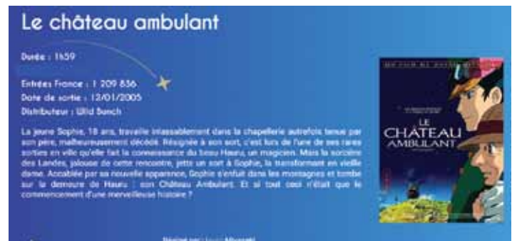
Film retenu pour le cinéma en plein air comble

Le film choisi après consultation des montreuillais est Le château ambulant de Hayao Miyazaki.