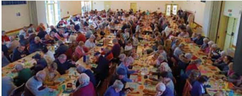
Loto, salle comble

Le lot surprise : un déjeuner pour deux personnes sur la Rance !