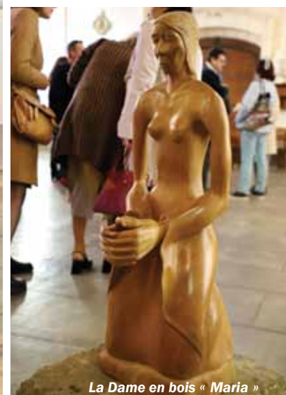
La Dame en bois « Maria »

23/04/2024 C'est formidable de conserver son talent pour faire plaisir à personne en faisant des œuvres d'art qui sont belles et tout ça pour moi parce que moi je les trouve très belles et formidable c'est mieux d'art. Alasienne 2024