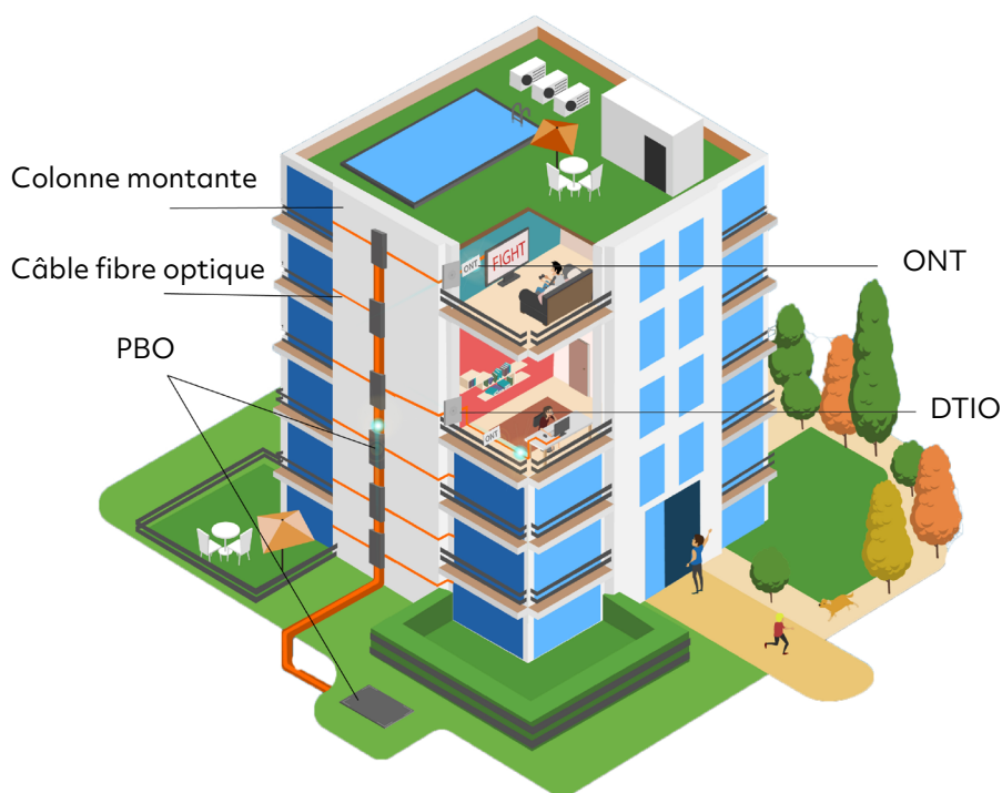
ONT : Optical Network Terminal DTIO : Dispositif de Terminaison Intérieure Optique

Les câbles seront déployés de préférence dans les parties communes pour en faciliter l'accès. Ils seront acheminés par une colonne montante à tous les étages grâce à des goulottes ou des gaines techniques. Des Points de Branchement Optique seront ensuite installés sur les paliers en fonction de la configuration de votre immeuble. La fibre optique passera ainsi des PBO jusqu'à l'intérieur de votre logement.