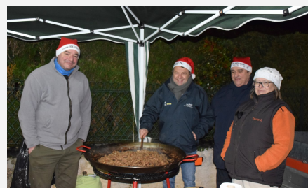
La ballade gourmande du 1er décembre Merci aux associations et à tous les bénévoles !