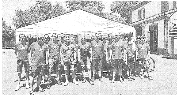
Les membres de Marssac Aventure prêts pour le départ !

tions le matin même, 10 euros par randonneur. En cours de route, deux postes de ravitaillement avec des gâteaux faits maison seront proposés sur les deux plus courts circuits et même trois pour le plus long parcours. À l'arrivée, des grillades et une bière seront offertes aux vététistes pour prolonger la rencontre sportive par un agréable moment de convivialité. Renseignements sur vetete.com ou bien en appelant le 06 14 08 57 29.