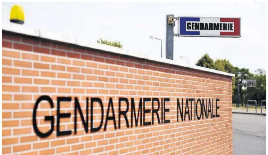
Une nouvelle brigade de gendarmerie devrait voir le jour en périphérie albigeoise.

Selon nos informations, trois communes se sont portées candidates pour accueillir cette nouvelle brigade : Puygouzon, Marssac-sur-Tarn et Carlus. « On est une commune en