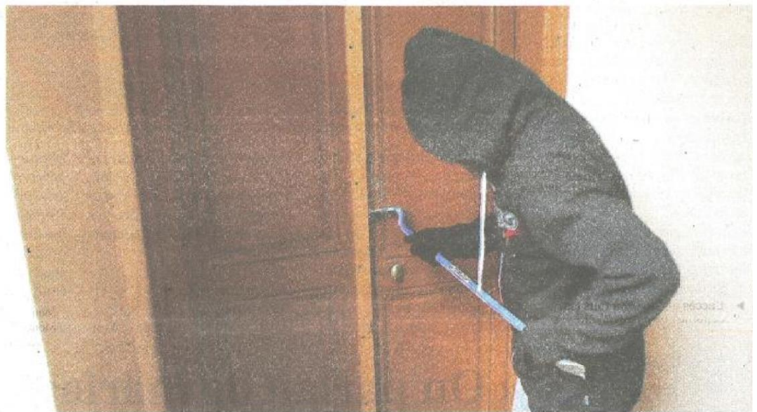
22 vols dans le Tarn, avec effraction pour la plupart, étaient reprochés à des prévenus.

22 faits de vols, avec effraction pour la plupart, lui sont reprochés à Albi mais aussi à Cambon, Marssac et à Agde. S'il a tout nié en bloc pendant ses auditions, l'homme, âgé de 42 ans, a changé de position face aux magistrats et en a reconnu quelques-uns. Ceux