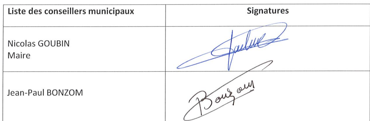
TABLEAU DES SIGNATURES DE LA SÉANCE DU 17 MAI 2024

L'Ordre du jour étant épuisé, aucune autre question émanant du conseil municipal, Monsieur le Maire clos la séance à 20 h 00