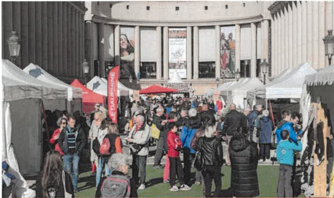
Photo de couverture : Le Grand Bivouac - Albertville