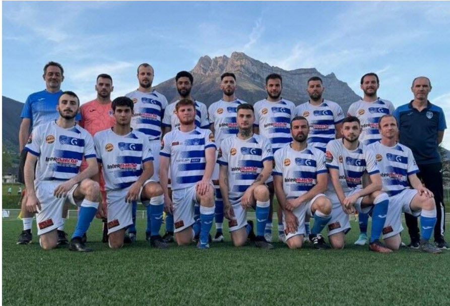
Saint-Pierre Sport se déplace à Pont-de-Beauvoisin en championnat de départemental 1.

Ce dimanche 21 avril à 15 heures, Saint-Pierre sports se déplace sur le terrain de l'US Pont-de-Beauvoisin, pour le compte de la dix-septième journée du championnat de départemental 1. Lourdemment battue le week-end dernier à domicile par le FC Haute Tarentaise (0-5), la formation dirigée par Stéphane Sebti voudra faire bonne figure chez le leader et si possible engranger de précieux points dans l'optique du maintien. Dans le même temps, en championnat de départemental 4, la réserve rend visite à son homologue du FC Sud Lac à Voglans. Enfin, chez les jeunes, les U17 reçoivent le Groupement Jeunes la Savojarde ce samedi à 15 heures en championnat de départemental 2.