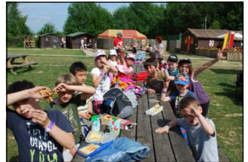
Sortie des enfants à Sherwood Parc