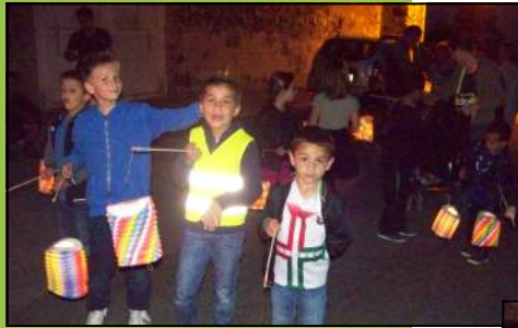
La Fête communale