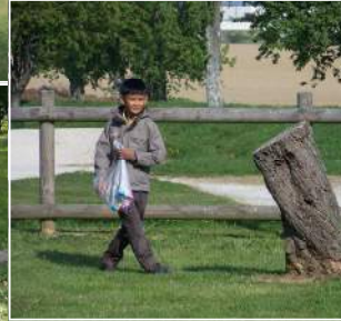
Ouverture du Festival Printemps de Paroles dans le parc du Château.