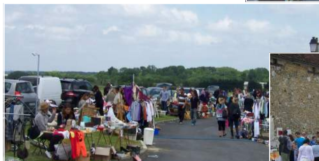
La Fête communale