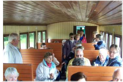
Voyage des Anciens dans la Baie de Somme