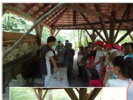
Sortie des enfants au château fort Guédelon