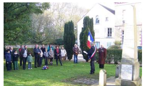
Commémoration du 11 novembre 1918