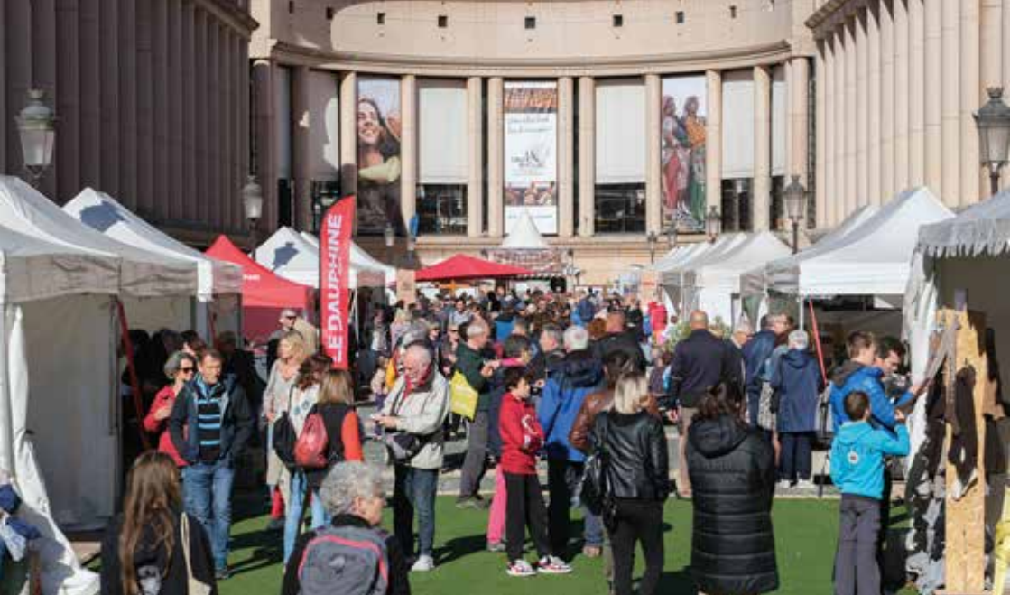
Photo de couverture : Le Grand Bivouac - Albertville