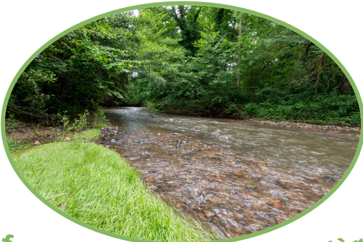
Le fonctionnement des rivières