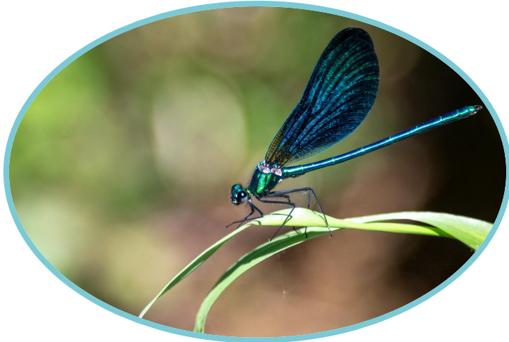
La biodiversité des milieux aquatiques