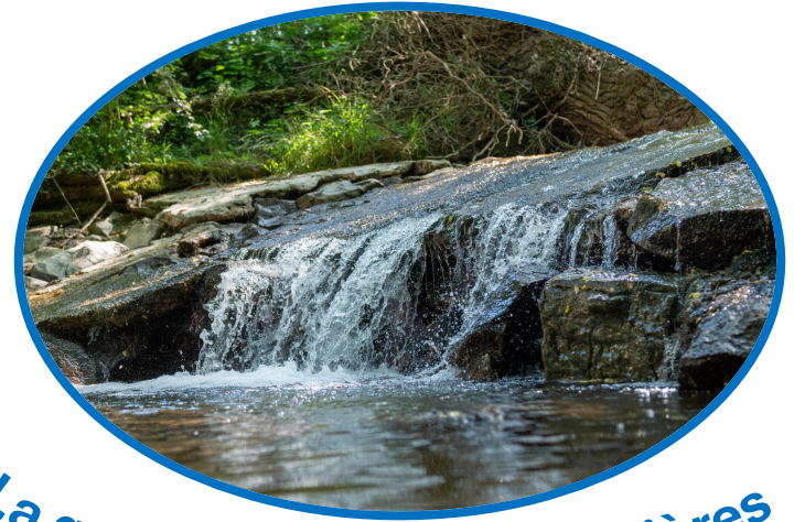
La qualité de l'eau des rivières