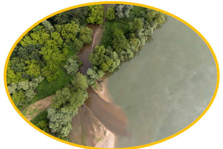
L'eau et l'art