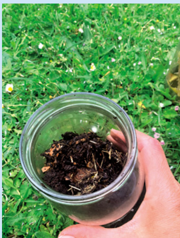
Compost en cours de décomposition.

Pour aller plus loin, consultez le site Internet de la Métropole Rouen Normandie : www.metropole-rouen-normandie.fr/les-dechets-alimentaires