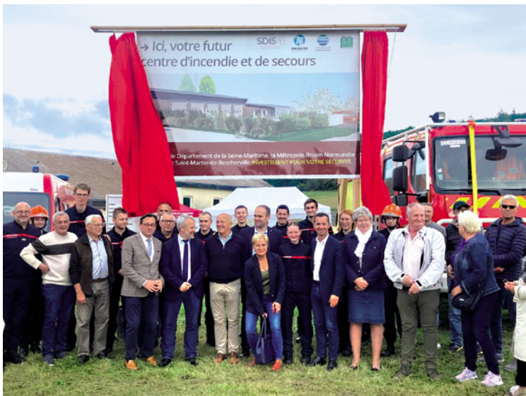
Inauguration du panneau de chantier du futur centre d'incendie et de secours du village.