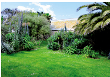
Tatihou: la tour Vauban et le jardin du Lazaret.