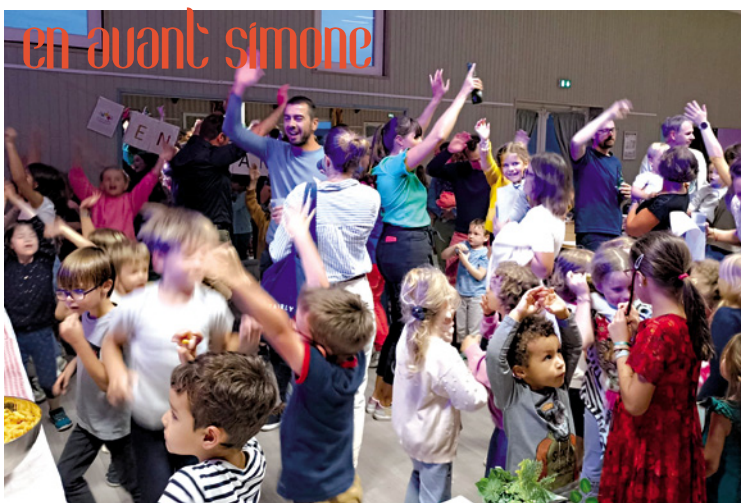
La soirée d'intégration des nouveaux parents d'élèves a rassemblé 122 personnes à la salle des fêtes, le 29 septembre.