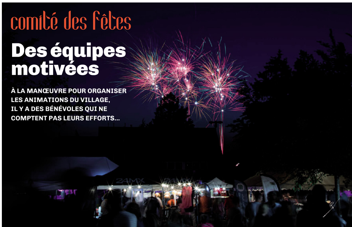
Le feu d'artifice du 25 juin.