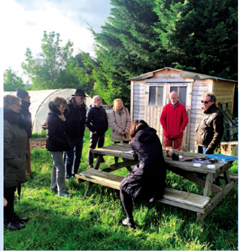
Un atelier compostage dans les jardins partagés.

LES BIODÉCHETS DOIVENT DÉSORMAIS ÊTRE RECYCLÉS, NOTAMMENT GRÂCE AU COMPOSTAGE. LA MÉTROPOLE A ORGANISÉ DES ATELIERS SUR CE THÈME À SAINT-MARTIN