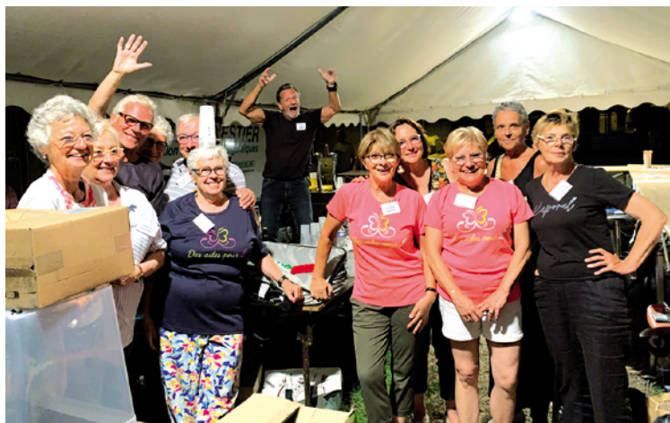
L'équipe du Comité au Mardi du 25 juin.