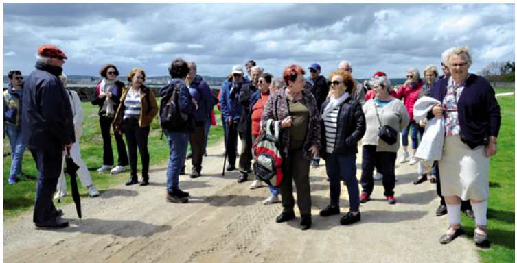
Le groupe des anciens à l'écoute des explications du guide.

Nous commençons par la visite du site du phare de Gatteville, le deuxième de France et même d'Europe pour sa hauteur : 75 mètres *. Personne ne s'est risqué à monter là-haut !