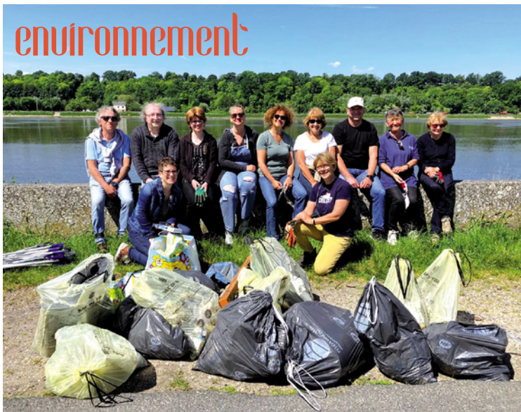
Les volontaires au bord du fleuve devant leur récolte particulière.

Le robot Ceora est sous surveillance satellite permanente et il transmet instantanément une alarme s'il est touché ou déplacé. Il ne présente aucun risque pour les animaux ou pour les enfants car il est équipé d'un capteur de détection d'objet pour éviter toute collision.