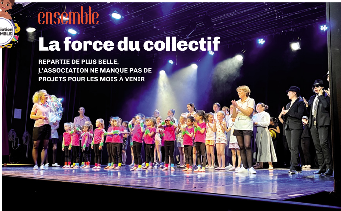
Le spectacle de danse au théâtre de Duclair, le 8 juin dernier.

REPARTIE DE PLUS BELLE, L'ASSOCIATION NE MANQUE PAS DE PROJETS POUR LES MOIS À VENIR