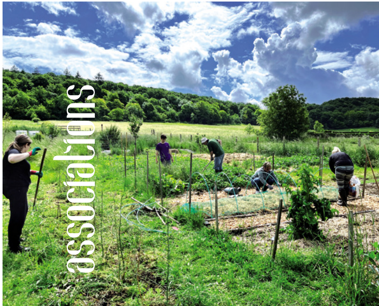
Au travail à flanc de coteau. Ci-dessous : quelques beaux légumes récoltés.