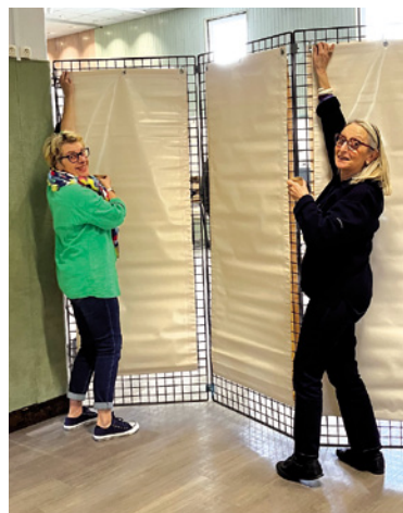
La préparation de l'exposition de peinture.