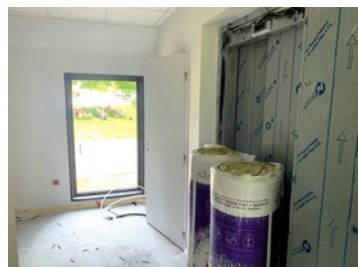
La mairie en travaux : ici, l'extension qui sera, au final, la nouvelle salle des mariages.