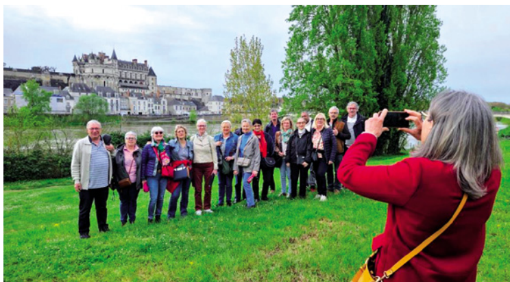
Le Comité de jumelage à Chinon.

présenter leur nouvelle pièce de théâtre, Répétition . À noter sur votre agenda, la date du samedi 12 octobre. Nous aurons aussi le plaisir d'accueillir des artistes tourangeaux lors du Salon des artistes boschervillais, les 19 et 20 octobre.