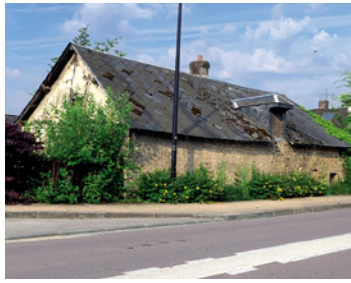
Cette maison va être détruite pour agrandir le parking voisin.

Une piste cyclable protégée va être implantée. Première phase des travaux : route du Moulin, en haut du chemin de la Cavée jusqu'à Canteleu. La deuxième phase, en cours d'étude, portera sur l'extension de la piste jusqu'au rond-point Saint-Gorgon, puis sur le prolongement des travaux de la route de Duclair dans la descente de Saint-Martin jusqu'au garage.