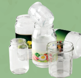
Bocaux de conserves et pots en verre