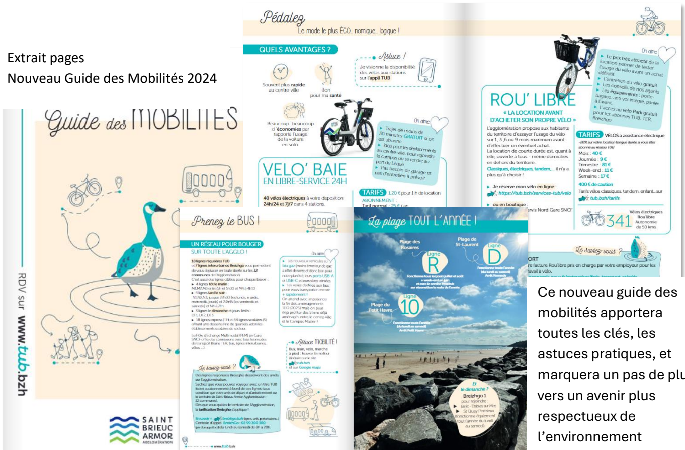
Extrait pages Nouveau Guide des Mobilités 2024

Ce nouveau guide des mobilités apportera toutes les clés, les astuces pratiques, et marquera un pas de plus vers un avenir plus respectueux de l'environnement