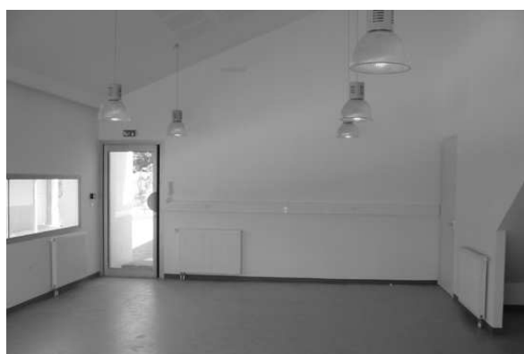
Vue intérieure de la maison des associations et des loisirs

Après de multiples péripéties, le chantier, débuté en décembre 2007, touche enfin à sa fin avec la mise en peinture et la pose des sols dans les salles d'activité, l'installation des placards et des derniers éléments sanitaires, le montage des volets pare-soleil et de la porte d'entrée en bois de la galerie couverte.