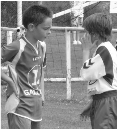
Dernière mise au point avant match