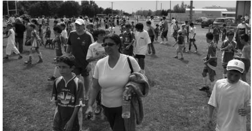
La foule des grands jours