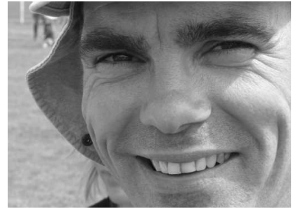
Des organisateurs fatigués mais heureux

Malgré une chaleur écrasante, les participants comme les organisateurs se sont déclarés heureux et satisfaits de ce cru 2009.