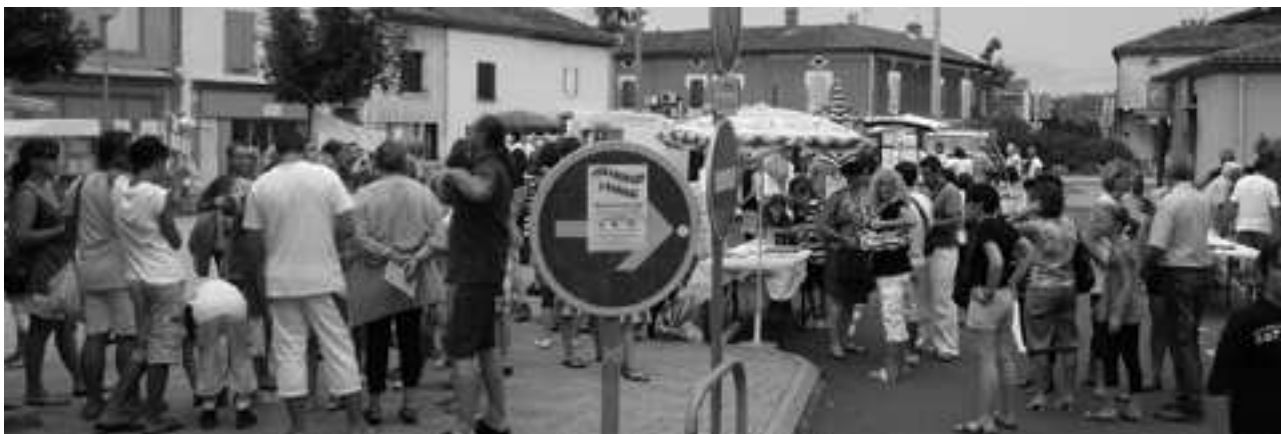
La place du Barry bien remplie, des parents attentifs, des danses, des jeux, du sport...