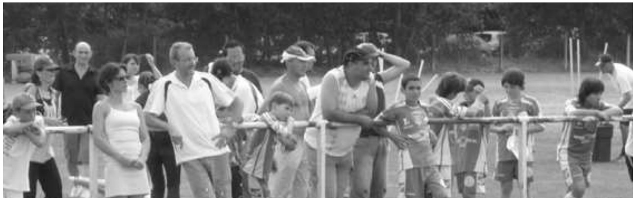
Des spectateurs attentifs