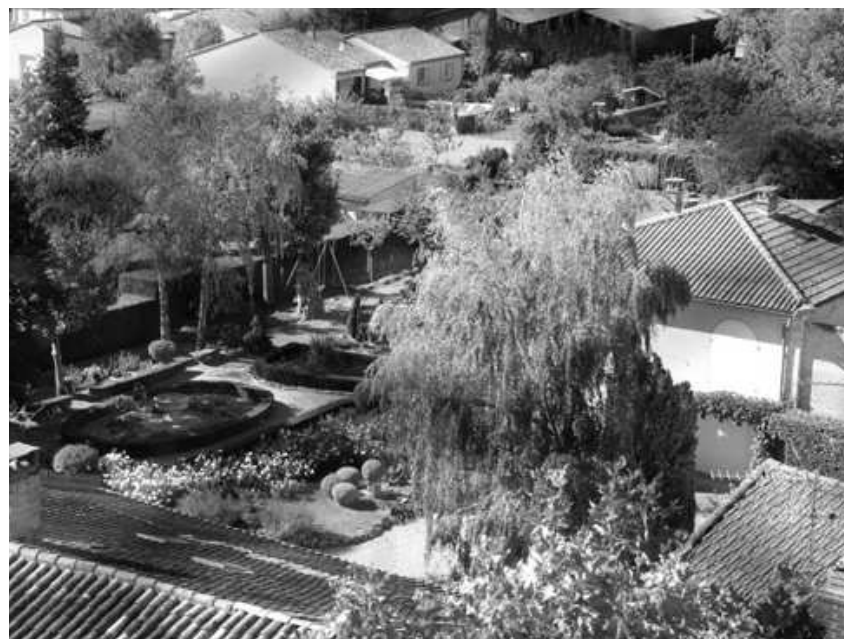
Photo prise du clocher de l'église lors des journées du patrimoine.