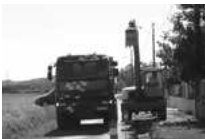
Chemin de Lavergne