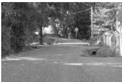
Chemin de Guilhe

Le groupement d'entreprises Malet-Colas entreprend depuis début septembre et pour une durée d'un mois la rénovation de 4 voies communales (chemin rural des peupliers, chemin de Lavergne, chemin de Guilhe, rue du verdier), soit 2 kilomètres améliorés pour le confort de tous.