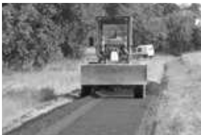
Chemin des peupliers