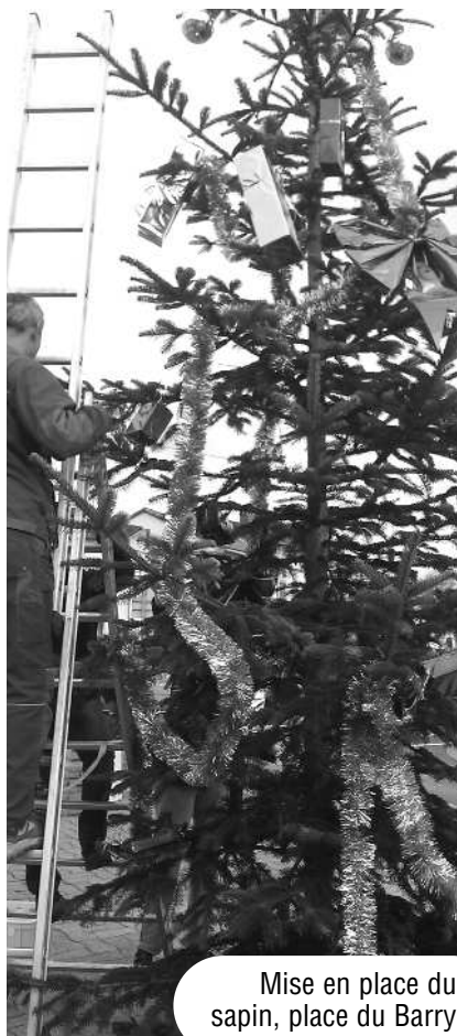
Mise en place du sapin, place du Barry