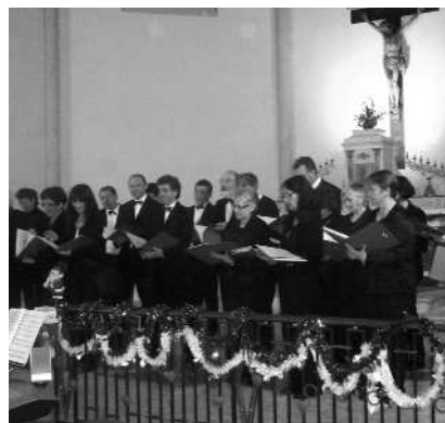
Concert de Noël en l'église de Marssac. Une foule nombreuse, un programme de qualité et le traditionnel vin chaud servi par nos élus...