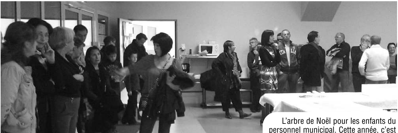
L'arbre de Noël pour les enfants du personnel municipal. Cette année, c'est une "Maire Noël" qui s'est occupée de la distribution des cadeaux...