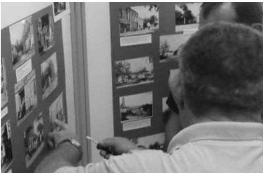
Discussions animées autour des photos : les souvenirs affluent...