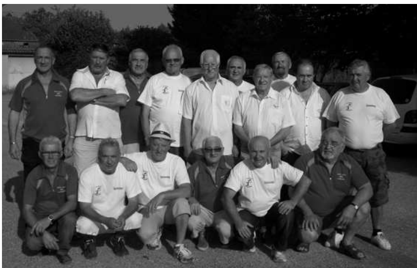
Les vétérans de la Boule Marssacoise et l'équipe de Gambetta Carmaux