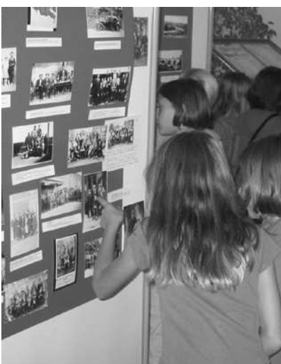
Les élèves de l'école découvrent le Marssac d'autrefois !