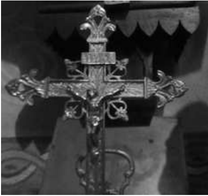
Trésors discrets de notre église