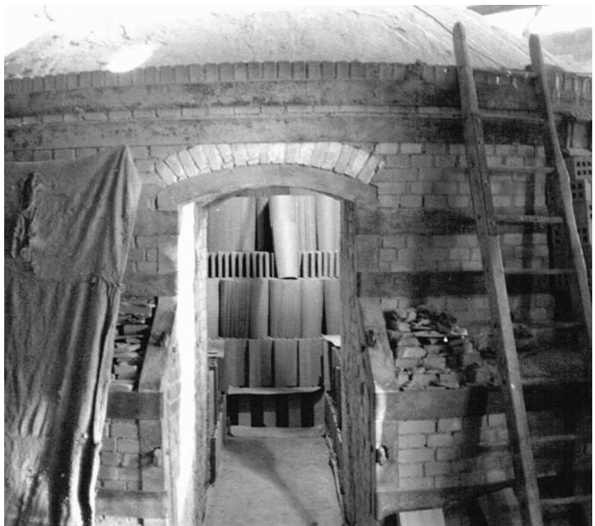
Le four à flamme renversée