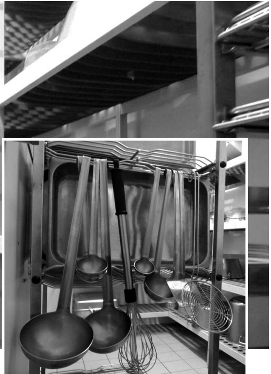
Une impressionnante réserve de plats, louches, poêles, casseroles, fouets de toutes tailles, de toutes formes...