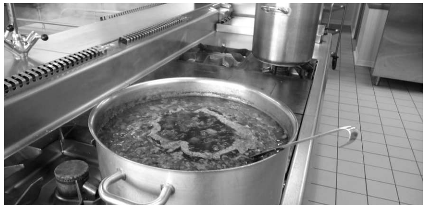
Pendant que dans la salle froide (11°) on s'applique à couper et à répartir les tranches de jambon, en cuisine les légumes sont mixés après cuisson.