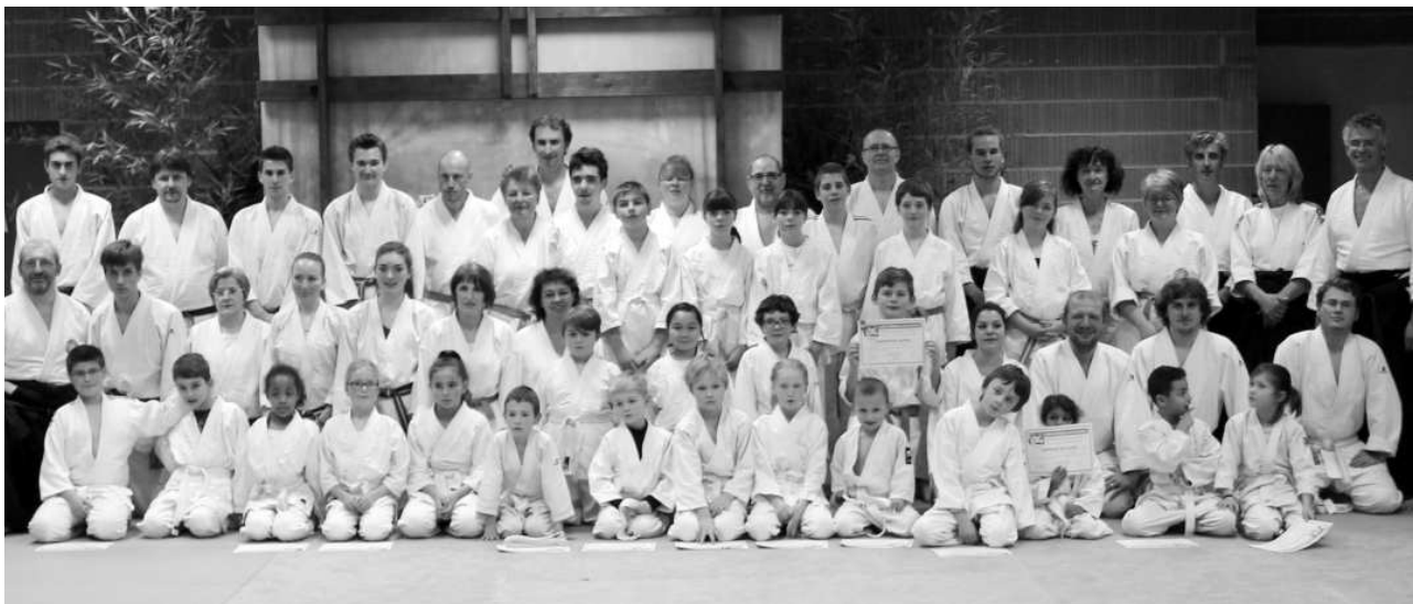
Un Kagami Biraki très suivi

C'est tout d'abord 2014 qui s'est achevé sur une belle note d'unité : par un froid dimanche d'hiver, à l'heure où d'autres sommeillaient encore bien au chaud, 29 pratiquants de Wa-Jutsu de Marssac, Terssac et même Toulouse se sont retrouvés à Terssac pour un cours commun très suivi. Cela a été l'occasion d'un travail de fond pendant plus de 3 heures sur la respiration et la stabilité, piliers fondamentaux de cet art martial. Convivialité oblige, l'auberge espagnole qui a suivi a été aussi un franc succès.