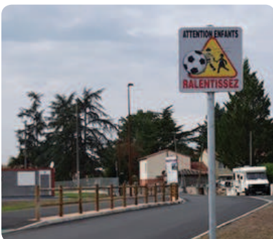
Attention enfants : ralentissez !

C'est un éclairage à led, moins énergivore que les ampoules à sodium, qui a été installé sur les façades des maisons, tout au long de la rue. Deux lampadaires sur mâts seront installés en complément, au moment des travaux de voirie. Ceux-ci devraient démarrer dès janvier 2019. La fin du chantier approche !