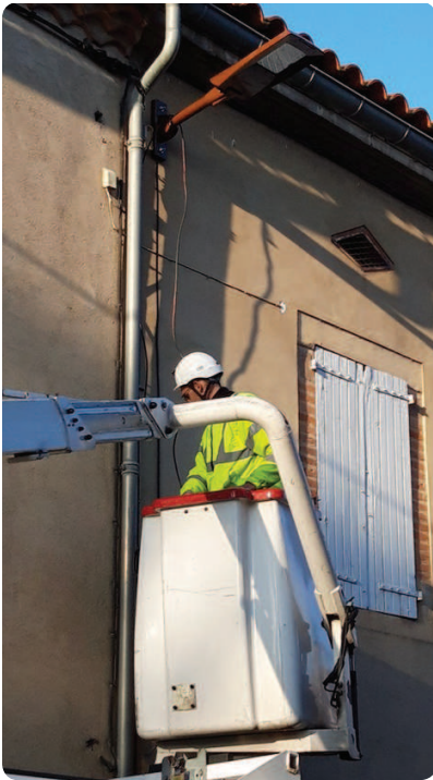
Rue du nord, l'éclairage public fonctionne

C'est un éclairage à led, moins énergivore que les ampoules à sodium, qui a été installé sur les façades des maisons, tout au long de la rue. Deux lampadaires sur mâts seront installés en complément, au moment des travaux de voirie. Ceux-ci devraient démarrer dès janvier 2019. La fin du chantier approche !