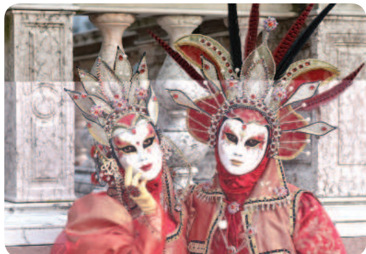
Cette année, Marssac prendra des airs de Venise