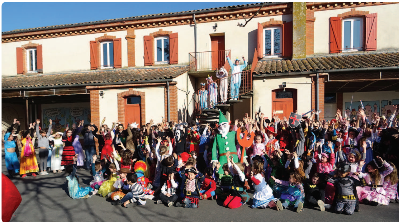
Le carnaval de l'école