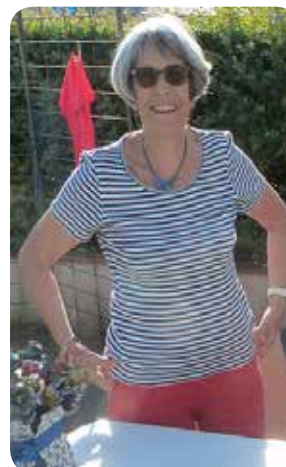
Passion et talent

Par manque de place il ne nous a pas été possible de mettre plus de photos. Nous le regrettons. Retrouvez la liste complète des associations de Marssac avec leurs coordonnées téléphoniques dans le Marssac Info de septembre 2021. Vous pouvez également la demander en mairie.