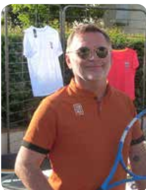
Marssac Florentin Aussac Tennis Club