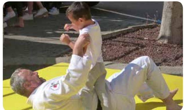
Judo Club Marssacois