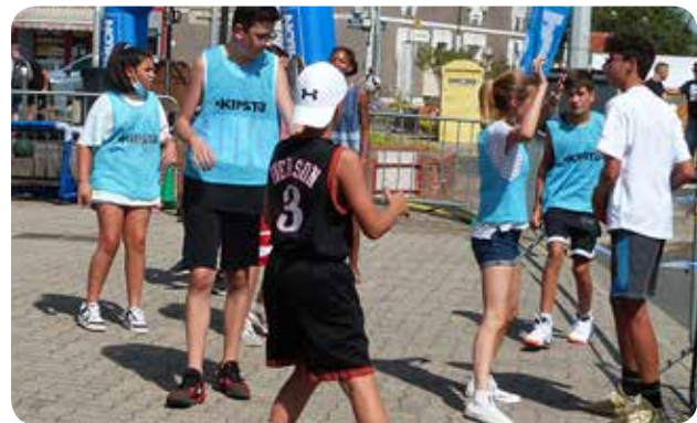
Marssac Basket Club