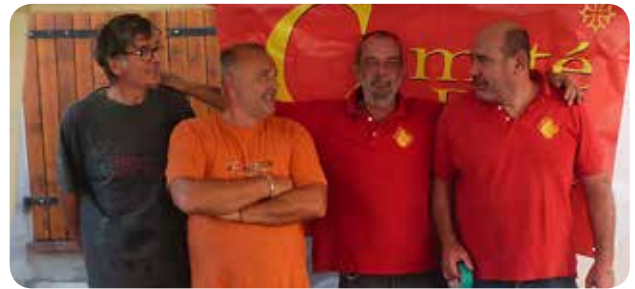
Comité des fêtes

Un grand merci aussi à Pierre M. pour son reportage photo.