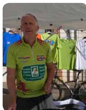
Les Rives du Tarn Running