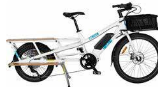
Vélo Longtail électrique