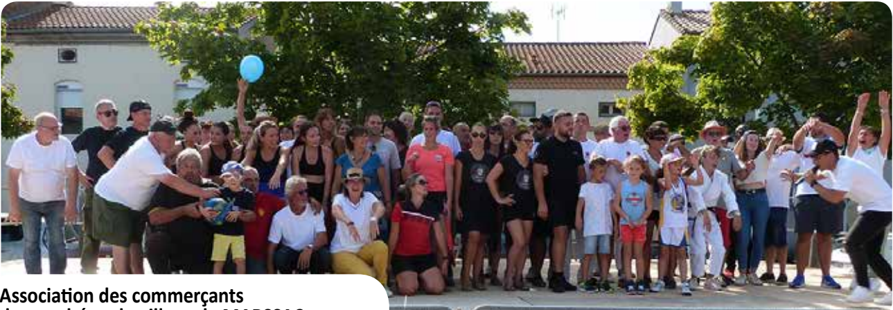
Association des commerçants du marché et du village de MARSSAC