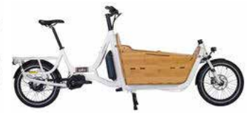
Vélo cargo biporteur électrique

Sachez que pour tout achat d'un vélo neuf, qu'il s'agisse d'un vélo classique, d'un vélo à assistance électrique ou d'un vélo cargo, vous pouvez bénéficier d'une aide à l'achat, sans conditions de ressources. Celle-ci se monte à 25% du prix TTC du vélo. Le montant maximum de l'aide est de 100 € pour un vélo classique ou vélo pliant, 250 € pour un vélo à assistance électrique et 500 € pour un vélo cargo.