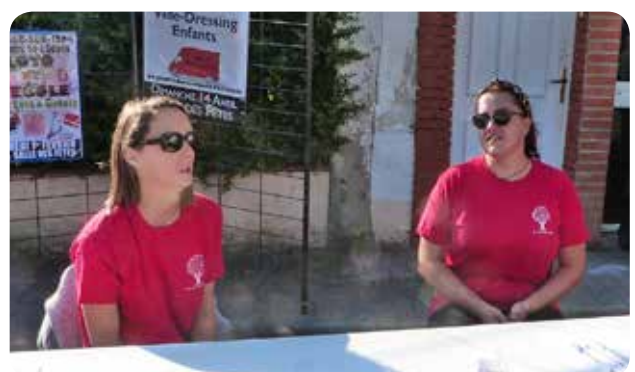
Les Amis de l'école