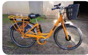
Vélo à assistance électrique (VAE)

Vous avez testé, et vous voilà décidé à acheter un vélo, avec ou sans assistance électrique !