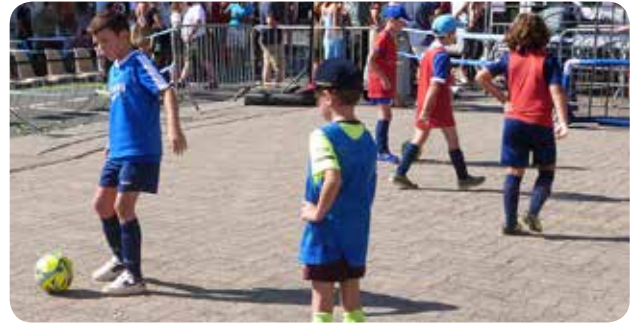
Albi Marssac Tarn Football