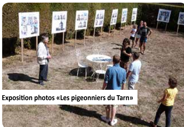
Exposition photos «Les pigeonniers du Tarn»

Une fois par mois, les archives départementales du Tarn ouvrent leur auditorium, à 18h, pour les «Vendredis de l'Histoire». L'entrée est gratuite. Il faut par contre s'inscrire obligatoirement au 05 63 36 21 00. Adresse : 1 Av de la Verrerie à Albi.