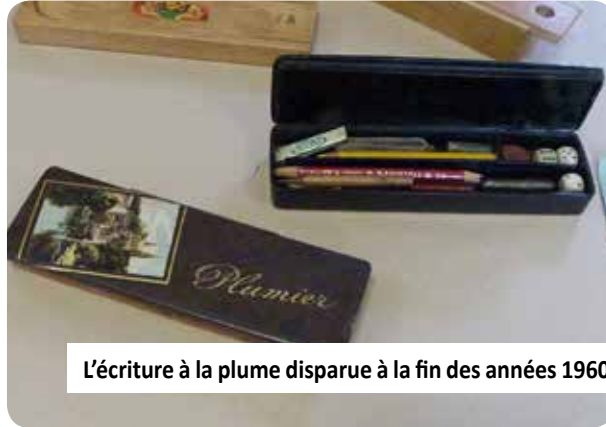
L'écriture à la plume disparue à la fin des années 1960