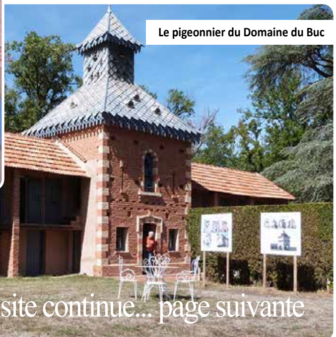
Le pigeonnier du Domaine du Buc