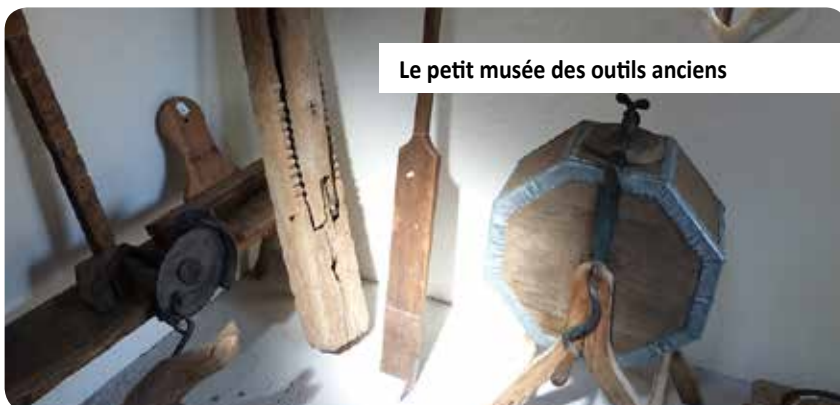
Le petit musée des outils anciens