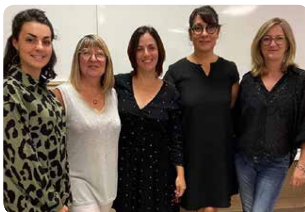
Le nouveau bureau de Tempo Harmony.