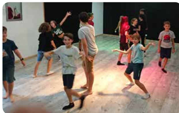
«Le Théâtre donne des ailes, à quiconque souhaite s'envoler»