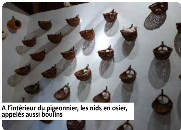
A l'intérieur du pigeonnier, les nids en osier, appelés aussi boulins