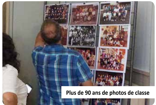
Plus de 90 ans de photos de classe