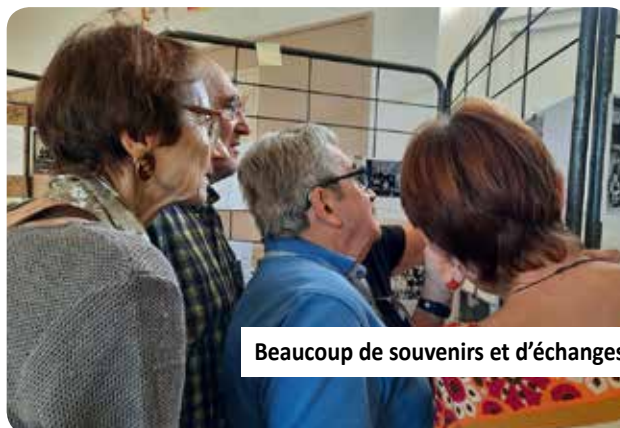
Beaucoup de souvenirs et d'échanges