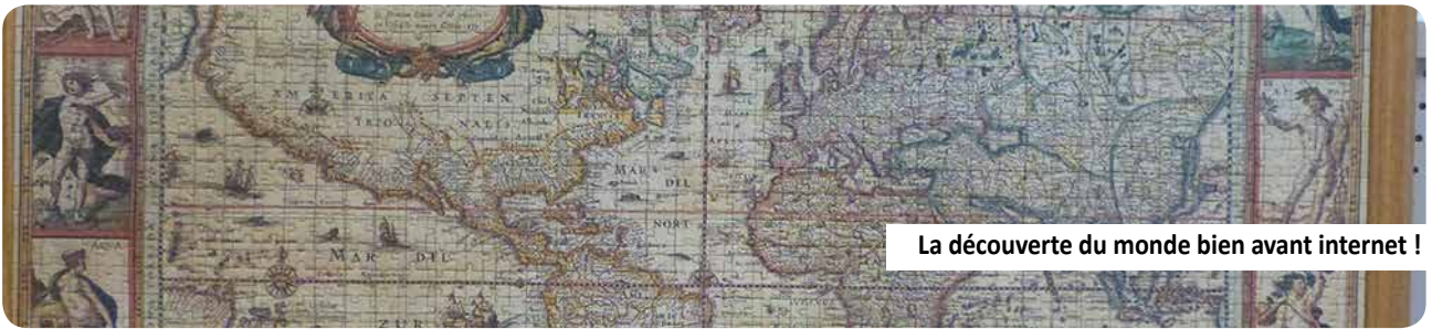
La découverte du monde bien avant internet !