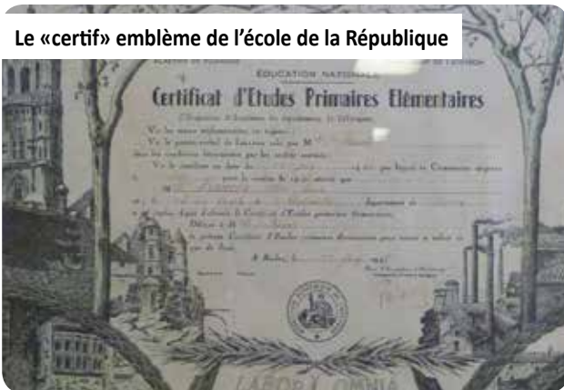
Le «certif» emblème de l'école de la République