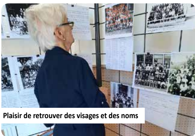
Plaisir de retrouver des visages et des noms