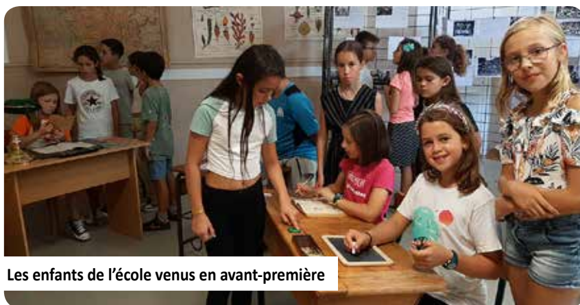
Les enfants de l'école venus en avant-première