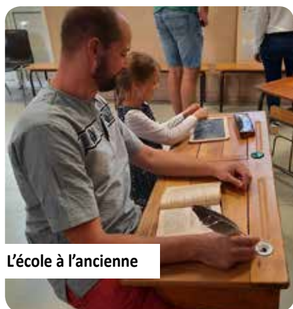
L'école à l'ancienne