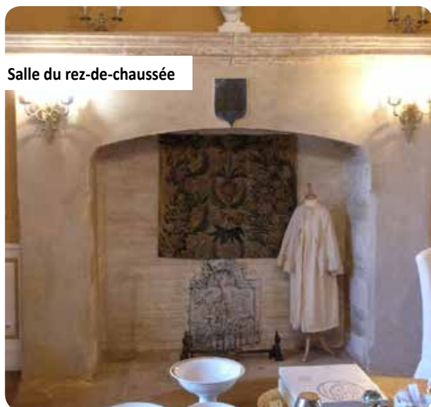
Salle du rez-de-chaussée