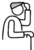
PERSONNES ÂGÉES DE PLUS DE 65 ANS