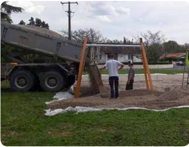
Nouvelle aire de jeux

Entre travaux d'entretien (tontes essentiellement), mise en place des tapis de fleurs, enlèvement des modules du skate-park, et multiples jours fériés, il y a eu peu de place ces derniers temps pour les travaux de l'aire de jeux de la rue Saint Exupéry qui est restée en standby plusieurs jours durant. Nos agents ont enfin pu reprendre le chantier. Les 150 tonnes de gravier sont posées ainsi que le bois délimitant le pourtour de l'aire. L'installation de la clôture périphérique est en cours. Reste encore à monter le jeu de «l'Araignée» qui nécessite l'installation d'une grue.