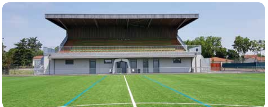
2023 Réouverture du stade Désiré Gach : terrain synthétique, nouveaux vestiaires, nouvelles tribunes