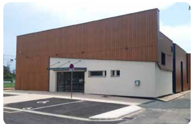
2023 / Réhabilitation de notre salle polyvalente