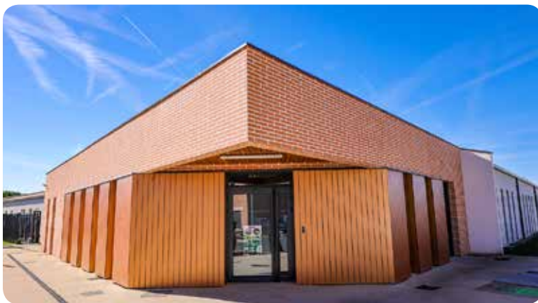
Rentrée 2020 / Nouvelle école élémentaire