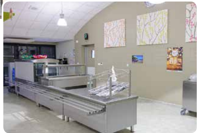
2019 / Agrandissement du restaurant scolaire avec self service