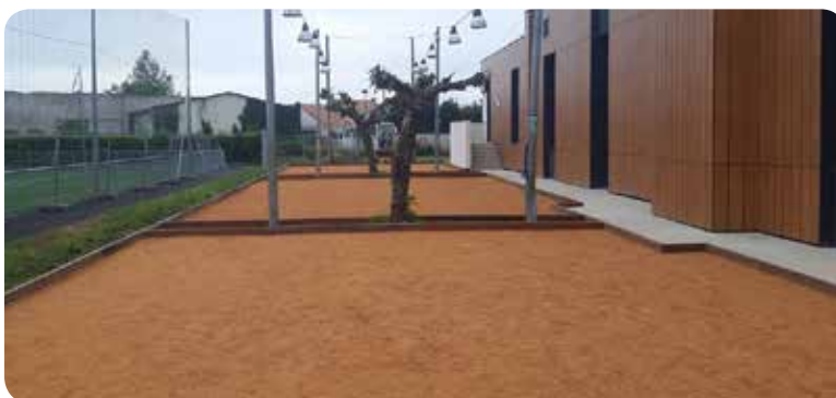
2023 / Réhabilitation du boulodrome