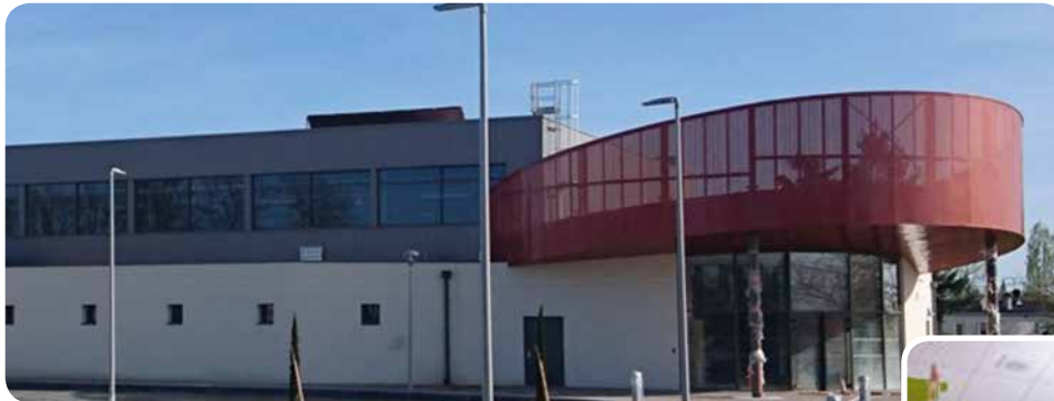
2018 / Ouverture du complexe omnisports

Au moment où nos deux chantiers phares se terminent, retour sur les principaux chantiers de ces dernières années.