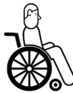
PERSONNES HANDICAPÉES OU MALADES À DOMICILE