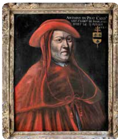
Cardinal Antoine Duprat, évêque d'Albi de 1528 à 1535

les différentes péripéties de la Vicomté du Castelvieu dépendant du Comte de Toulouse, de Simon de Montfort, enfin de l'Evêque d'Albi. En 1212 Marssac et Rouffiac étaient remis à l'Evêque d'Albi