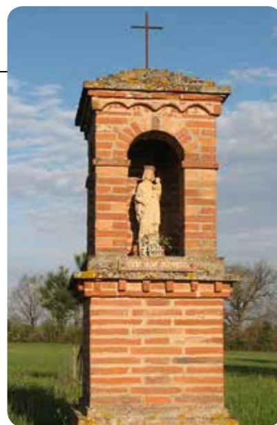
Notre-Dame d'Olivières, lieu de pèlerinage cité dans un document de 1355

Le règne d'Henri IV ne sera qu'un court répit. Le passeur qui a refusé le passage à des hommes d'armes est blessé d'un coup d'épée. Les marsacois doivent héberger les soudards traversant le pays. La compagnie de Bieules commet les pires excès hors la ville. A partir de 1628 la paix revient enfin, mais il s'ensuit des périodes de disette et de prospérité : les conditions climatiques en 1709 jointes à une épidémie de peste furent terribles : le froid devint si rude que la rivière Tarn était gelée, le vin dans les caves gela aussi, les arbres fruitiers périrent également. En octobre une violente crue emporta tous les moulins à l'exception du moulin du Cardinal Duprat. En raison de la disette le peuple croulait sous les impôts qui ne purent être payés qu'au bout de 40 ans.