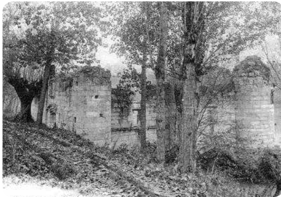
Ruine du dernier moulin drapier englouti par les eaux du barrage en 1951

Cela dura jusqu'en 1380, date à laquelle la guerre de Cent ans gagna l'Albigeois. En 1358 on avait procédé au renforcement des murailles et les habitants montaient la garde. Un des princi-