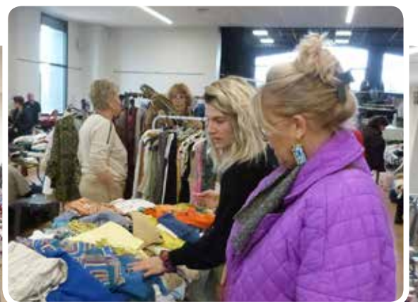
Un speed vide dressing réussi pour le Comité des Fêtes!