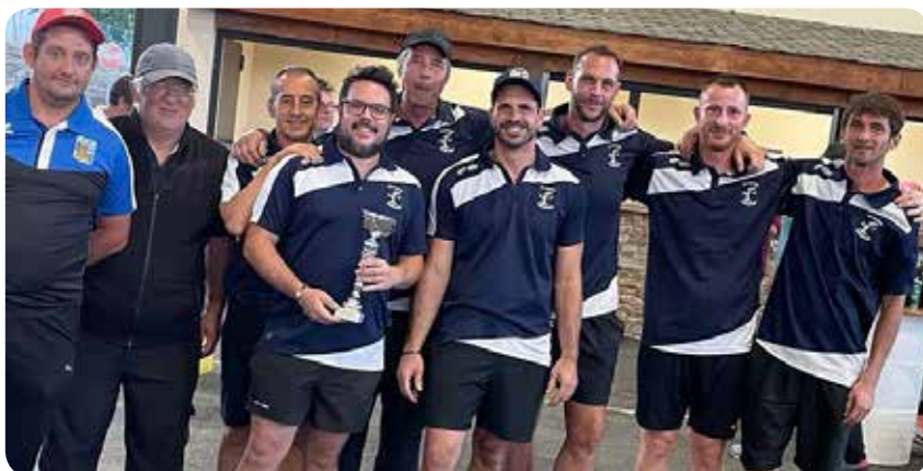
L'équipe séniors championne du Tarn des clubs 2023 en 6 ème division.