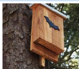
Un exemple de nichoir