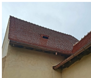
La chiroptière sur le toit de l'église St Romain

Ce dossier est suivi par les chiroptérologues de la SHNA ( société d'histoire naturelle d'Autun qui a une entité dans la maison du Parc ) ; ces personnes viennent effectuer des identifications régulièrement dans notre territoire. Il y a 25 espèces en Bourgogne ; certaines espèces sont « bio-indicatrices » : leur présence nous renseigne sur la qualité de notre environnement.