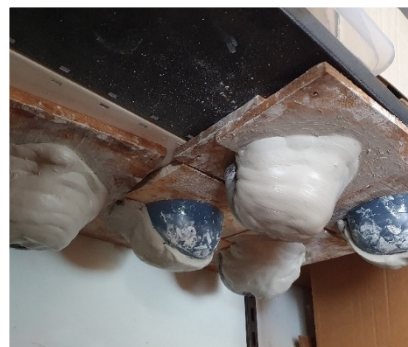
Temps de séchage des nids