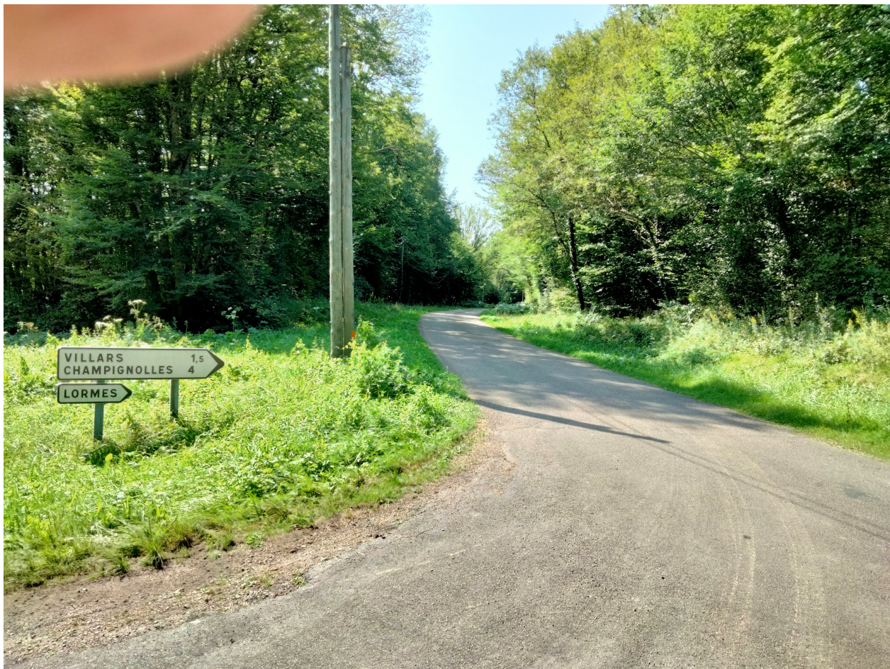
La route de Villars, 1.5 km restaurée à l'automne 2023.

Le coût définitif pour la commune est de 1126€