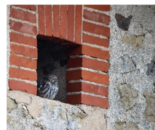
La Chevêche de la ferme à Domecy