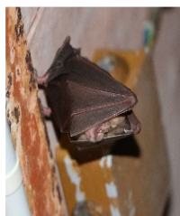
Petit rhinolophe dans une cave d'Usy

→ Les particuliers aussi peuvent accueillir des chauves-souris pour les aider à hiberner : en créant une petite ouverture dans une porte de cave, en installant des nichoirs à chauve-souris le long d'un mur de façade ou dans un verger. En cas de grosse colonie, contacter le Parc du Morvan qui peut aider à mettre en place un projet pour éviter les désagréments ( guano ).