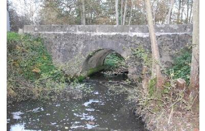
Le pont de Goblot

Avant la construction du premier pont en bois sur la Cure, les habitants utilisaient un gué qui se trouvait sous l'abbaye, l'île formée par la Cure et le Bief qui alimentait le moulin servait de lieu de stationnement.