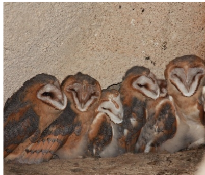
Les poussins du clocher de St Romain

Un nichoir adapté sera posé dans le clocher sur les conseils de la LPO et du Parc.