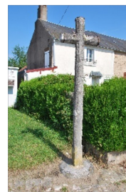
Croix à Villars