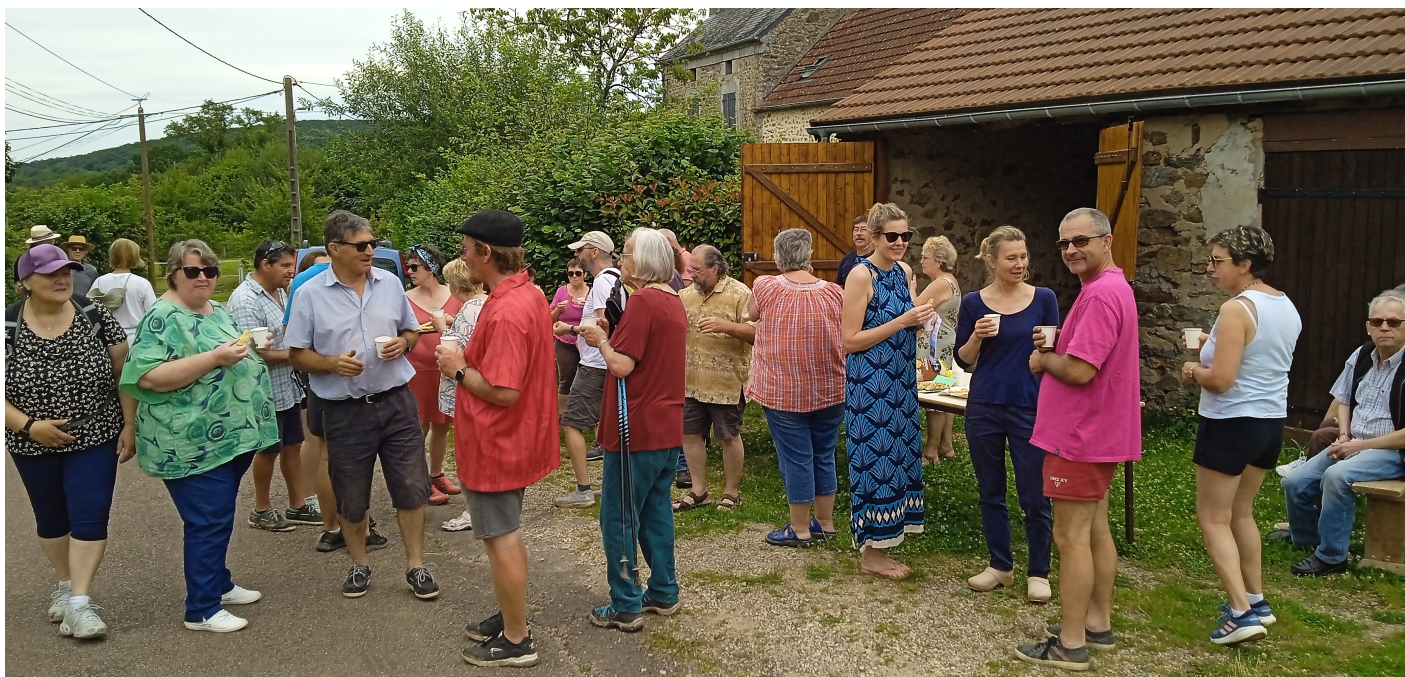
L'apéritif à Culètre.

Là, rejoints par beaucoup de nos concitoyens, les randonneurs purent se désaltérer et déguster les succulents gâteaux apéritifs, préparés et servis par des membres du conseil municipal et de l'association des « Amis du vieux Domecy ».