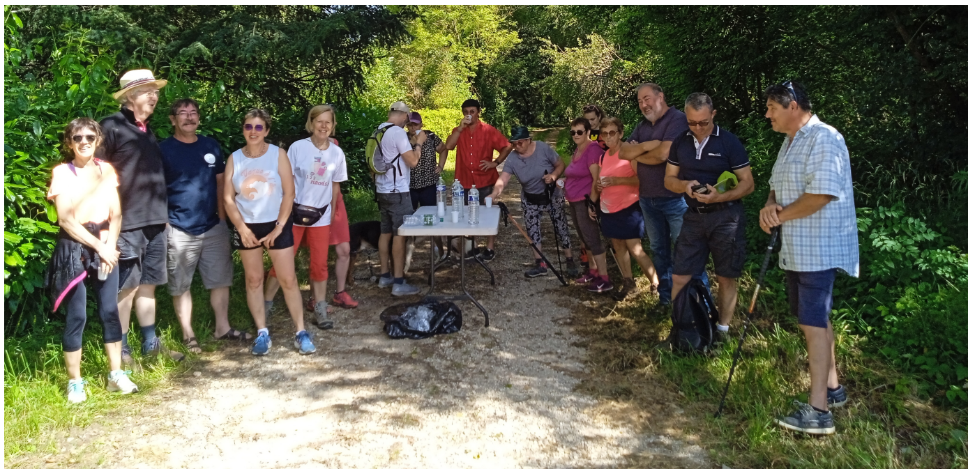
Les randonneurs à l'ombre des arbres à Domecy.

Mais il fallait bientôt repartir pour arriver à l'heure à l'apéritif ! A la sortie de Domecy, le groupe tourna à gauche pour emprunter la voie romaine. Après avoir gravi la rude côte dans la ligne droite, la petite troupe tourna à gauche, dans un sentier escarpé au milieu de la forêt. Heureusement, cette montée n'était pas trop longue, et les randonneurs purent vite reprendre leur souffle en marchant sur un chemin peu pentu mais humide pour atteindre le hameau de Villars. Il ne restait plus qu'à descendre la petite route pour arriver à destination, tout près de l'école de Culètre.