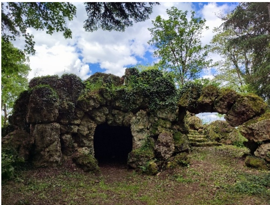
Un bel endroit du parc du château d'Orbigny.