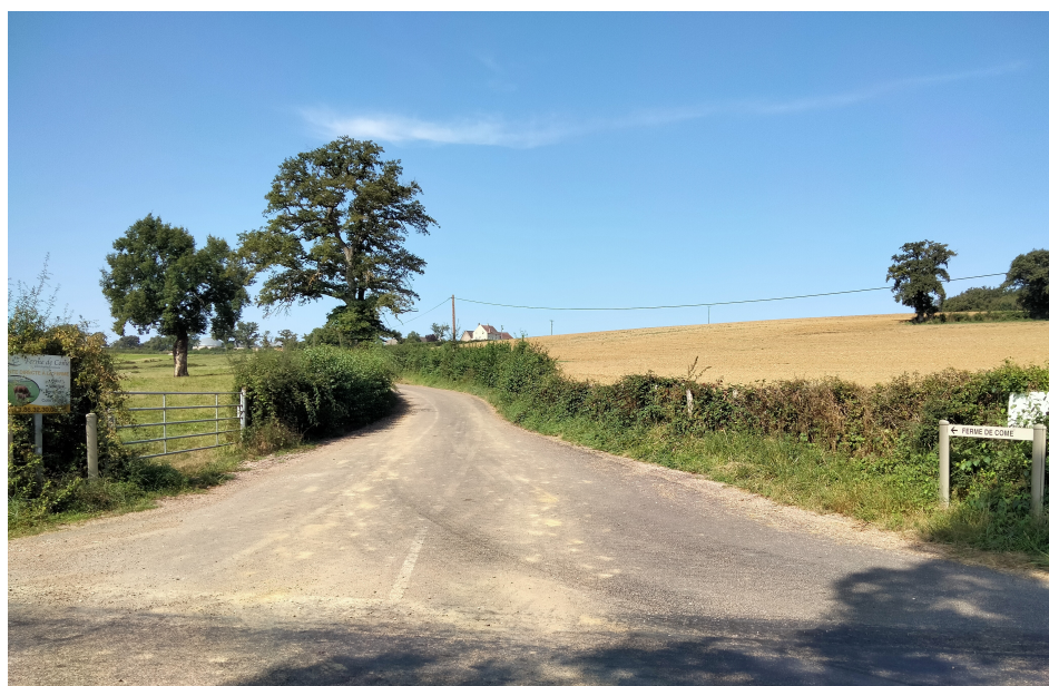
La Route de Come, 940m linéaires terminée fin 2023.

Nous avons au cours de cette année réalisé deux remises à niveau importantes :