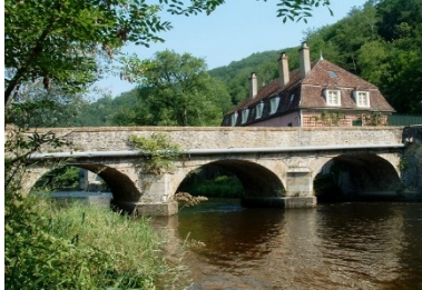
Le pont de Cure et la maison rose

Pour rejoindre les différents hameaux les habitants se servaient de passerelles et de ponts en bois et au fil du temps ceux-ci ont été construits en pierre.