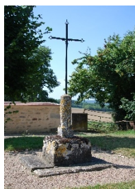
Croix de la Guette

Croix de chemin, croix de dévotion, croix de mission, calvaires et croix de cimetière, la commune en possède beaucoup, certaines ont disparu.