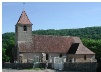
Saint Antoine et son cimetière

A Cure, au centre du village se trouve l'église Saint Antoine. Dans le cimetière mitoyen sont inhumés de nombreuses personnalités.