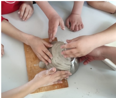
Assemblage des boudins d'argile sur le bol

Cependant, chaque année, des chutes de nids naturels ont lieu, parfois avec des jeunes dedans : il fallait de nouveau aider ces oiseaux ! Etant classée Zone Natura 2000 dans le Parc du Morvan, Domecy-sur-Cure bénéficie d'une dotation annuelle pour la biodiversité ; c'est donc grâce à cette aide financière et à l'appui logistique de la commune, qu'une intervention de 3h de la LPO ( ligue de protection des oiseaux ) a pu avoir lieu le 21 mars : d'abord avec un apport de connaissances sur les oiseaux du bâti, puis ensuite avec la construction de nids en argile. Ceux-ci seront posés pendant l'hiver.