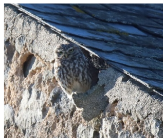
La Chevêche d'Usy

→ Une autre petite chouette sédentaire est présente à Domecy-sur-Cure et à Usy et observée régulièrement : la Chevêche d'Athéna qui est également une espèce protégée. Elle peut facilement se voir durant la journée, même si elle chasse essentiellement la nuit.