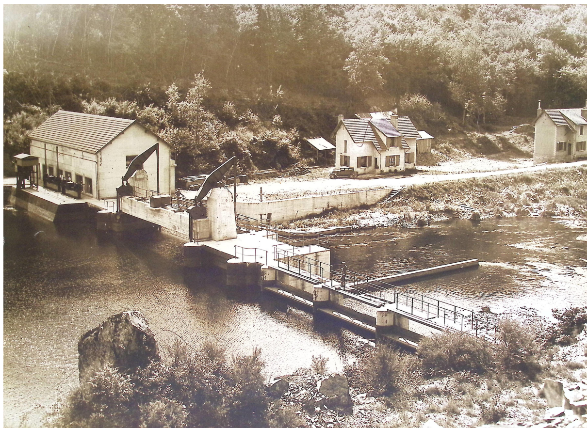
Malassis dans les années trente.