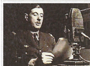
Appel du 18 Juin du général de Gaulle