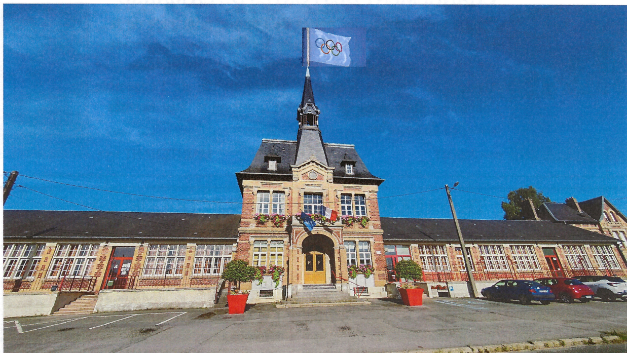
La mairie à l'heure olympique - photo du 15 août 2024