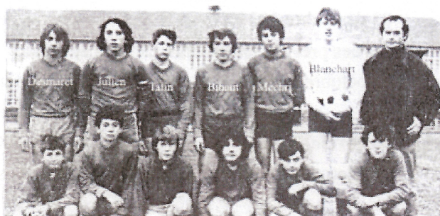
** footballers du CES Flavy