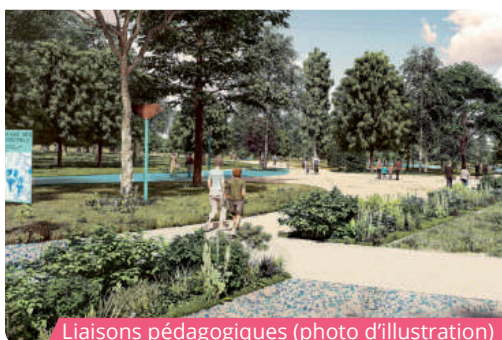
Liaisons pédagogiques (photo d'illustration)