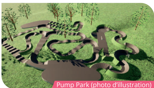
Pump Park (photo d'illustration)