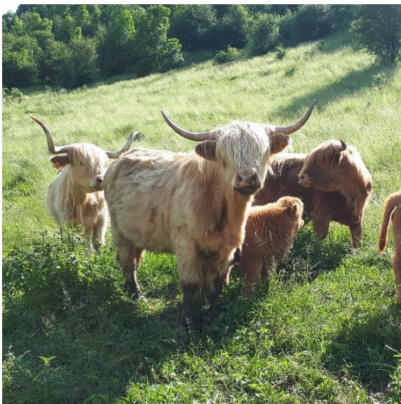
Vaches Highlands EARL du pré Gaillard