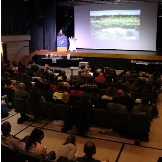
Colloque LIFE Climat tourbière du Jura 2024