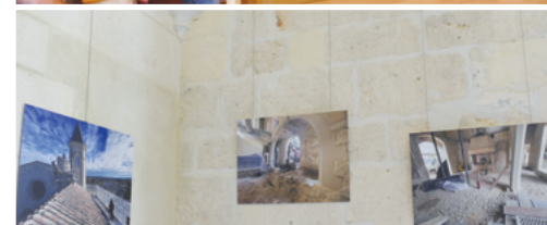
Exposition photos - Salle Bagnara