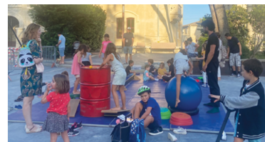
• Des animations de l'école de Cirque sous l'égide du Foyer Rural