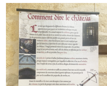
Exposition « Les Châteaux forts »