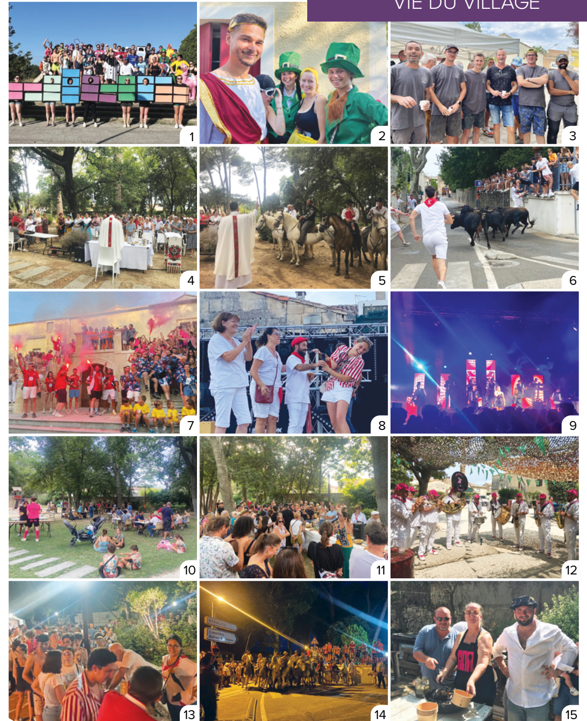
1 & 2. Fougasset. 3. L'équipe de choc des Services Techniques Municipaux. 4. Messe provençale et ses arlésiennes. 5. Bénédiction des chevaux. 6. Ouverture de la fête sur le thème de Pampelune. 7. Défilé des bandes. 8. Remise des clefs du village aux jeunes par Mme Le Maire. 9. Soirée avec Blackfox&DJ. 10. Après-midi belote/rami — jeux en bois et maquillage pour les enfants. 11. Apéritif municipal. 12. La Peña Mistral. 13. Soupe à l'oignon offerte par Mme Le Maire. 14. Les 20 taureaux pour les 20 ans de la Manade Vellas. 15. Concours de brasucade.

Notre village s'est rassemblé autour de divers moments conviviaux. Nous remercions vivement les nombreux acteurs qui ont contribué à la réussite de cette fête votive 2024 : le Club Taurin Lou Charlot, les Manades, les Orchestres et Djs, les Agents de Sécurité, le Policier Municipal ainsi que les Agents Municipaux.