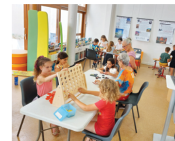
Ateliers jeux à la bibliothèque scolaire ouvert à tous