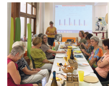
Déjeuner avec les bénévoles