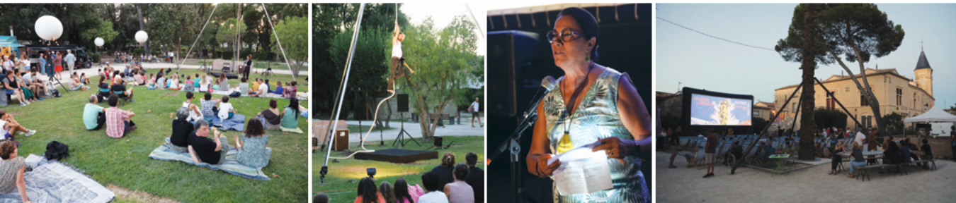
Cirque musical « Beethoven Metallo Vivace »