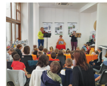
Kamishibai en musique Maternelles