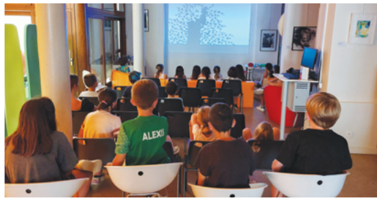
Projection surprise jeunesse