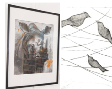
Exposition des peintures de l'atelier de Régine Pelé d'Arts&Zik