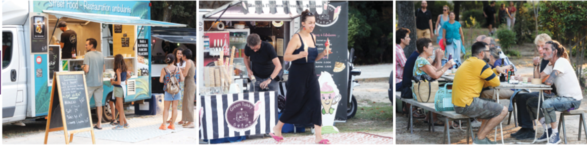
Stands de dégustation

Le 22 août, le public, réuni dans le parc du Château, a pu assister à un spectacle suivi du film dans une ambiance guinguette. La buvette était tenue par l'Association Equinel proposant vin, bières et softs.