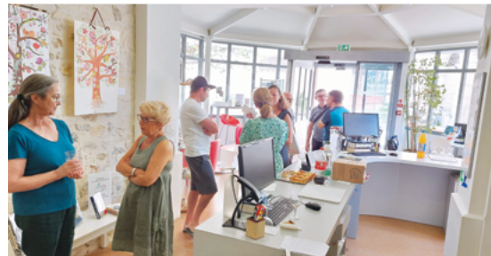
Apéro-décochage de l'exposition « Les trésors d'Arts&Zik »