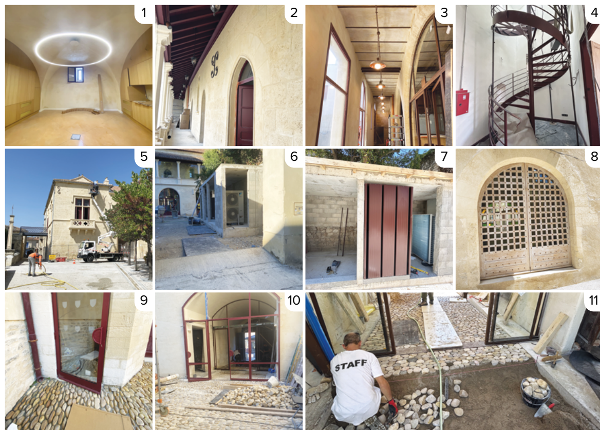
1 à 3. Pose des luminaires — Château et coursives. 4. Pose de l'escalier — archives. 5. Pose des pics sur les chemaux pour les pigeons. 6. Construction du local technique. 7. Pose des plaques phoniques. 8. Porte médiévale — aile ouest du Château. 9 à 11. Sols en calade.