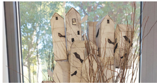
Exposition « Le village perché »