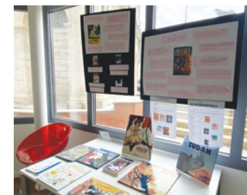
Prix des Incorruptibles avec les écoles