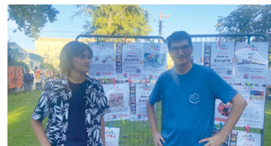
• Passion Jeux St-Drézéry