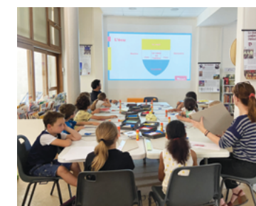
Initiation à l'Héraldique et l'art des blasons