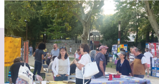
• Les stands

La municipalité renouvelle ses remerciements aux associations pour leur implication et leur participation à la vie sociale du village.