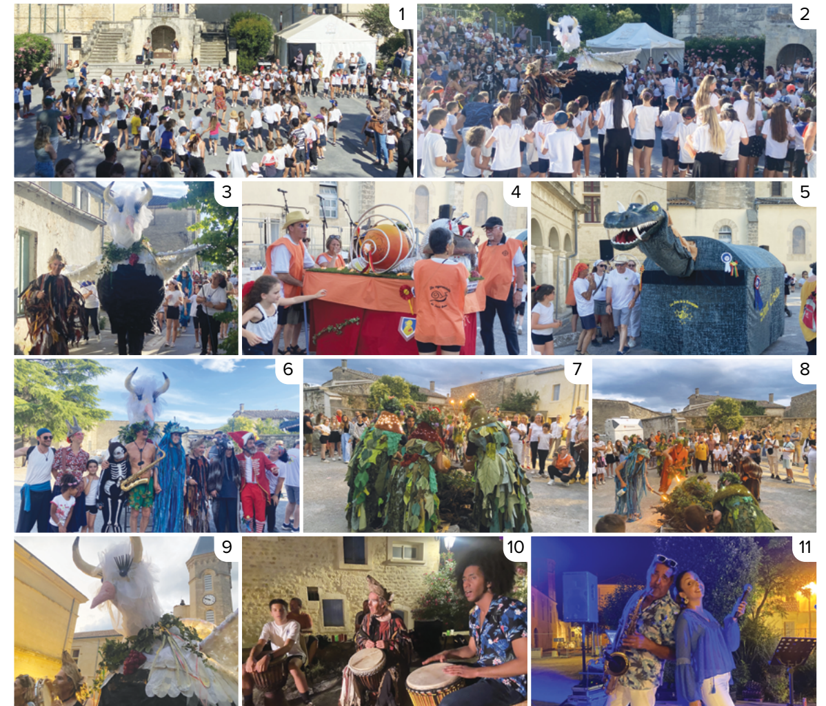
1. Danses traditionnelles avec les écoles. 2. Naissance du Colombiòu. 3. Déambulation dans les rues du village. 4. L'invitée « la Cagaraulette de St Brès ». 5. La marraine « La Baragogne de St Christol ». 6. Des acteurs de cette naissance. 7. Fleurs des garrigues en offrande au feu par l'Association SDNE. 8. Feu de la Saint-Jean. 9. Le Colombiòu et le Hérisson. 10. Les percussionnistes d'Arts&Zik. 11. Animation du bal par Pause Café.

Le Colombiòu est né ce 24 juin 2024 dans une grande et belle fête villageoise et intergénérationnelle où les enfants et leur famille ont pu danser, chanter et festoyer joyeusement. Il fait à présent partie de la famille des totems occitans regroupant plus de 70 villes et villages de l'Hérault qui ont eux aussi leur totem. Le Colombiòu est aujourd'hui impatient d'animer des temps forts et festifs de notre village. Son avenir appartient à ses habitants qui souhaiteront l'animer, le voir grandir et devenir plus populaire à chacune de ses nouvelles sorties.