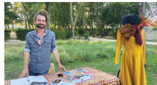
• La Cie Rosa Rossa