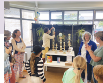
Apéro-décrochage Atelier poterie — Arts&Zik