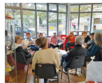
Mille et une feuilles